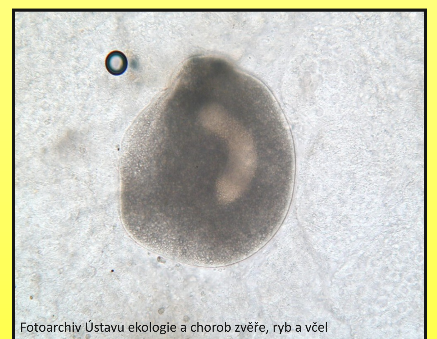
Obr. 3. I. multifiliis - trofont