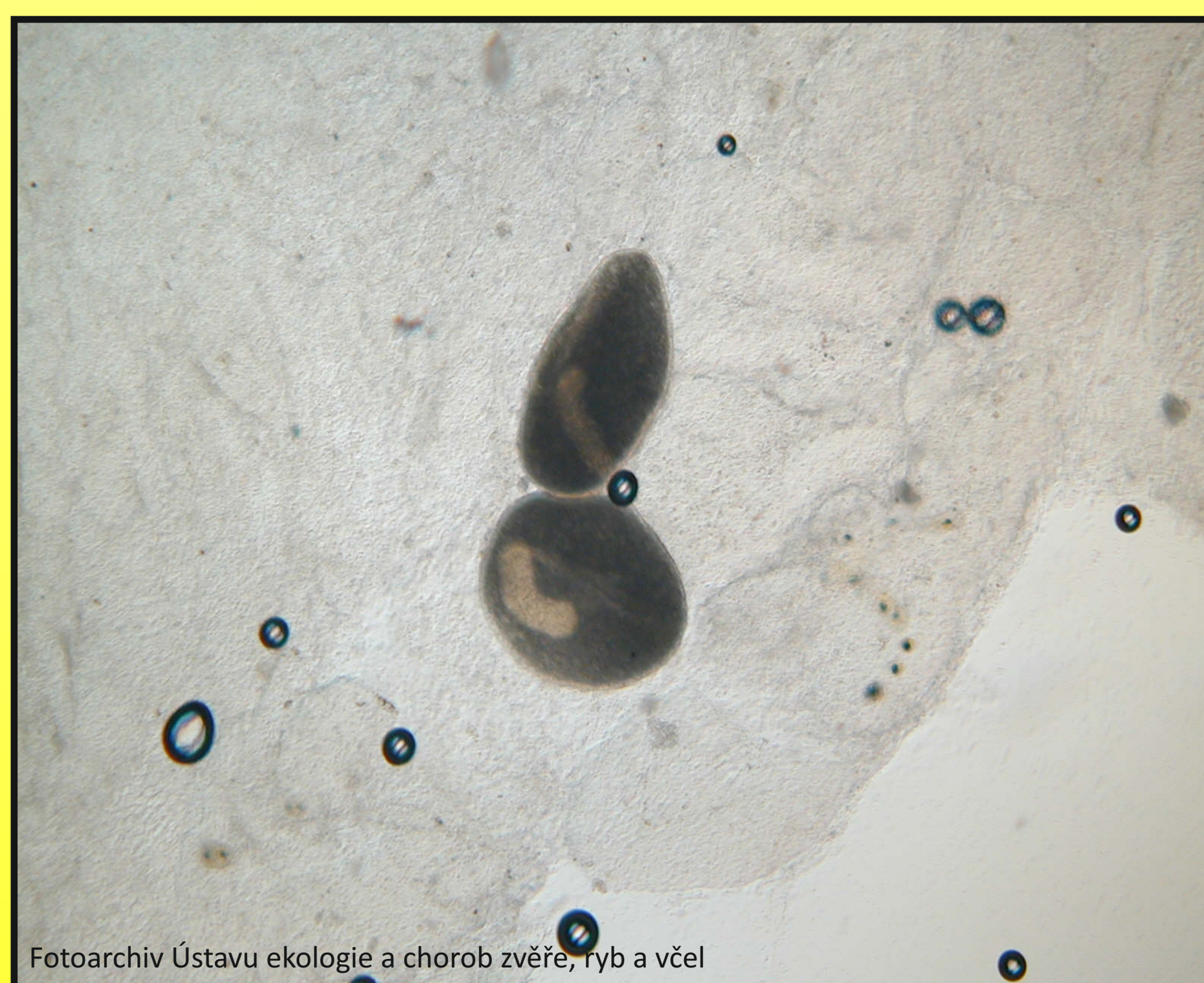
Obr. 2. I. multifiliis - trofont