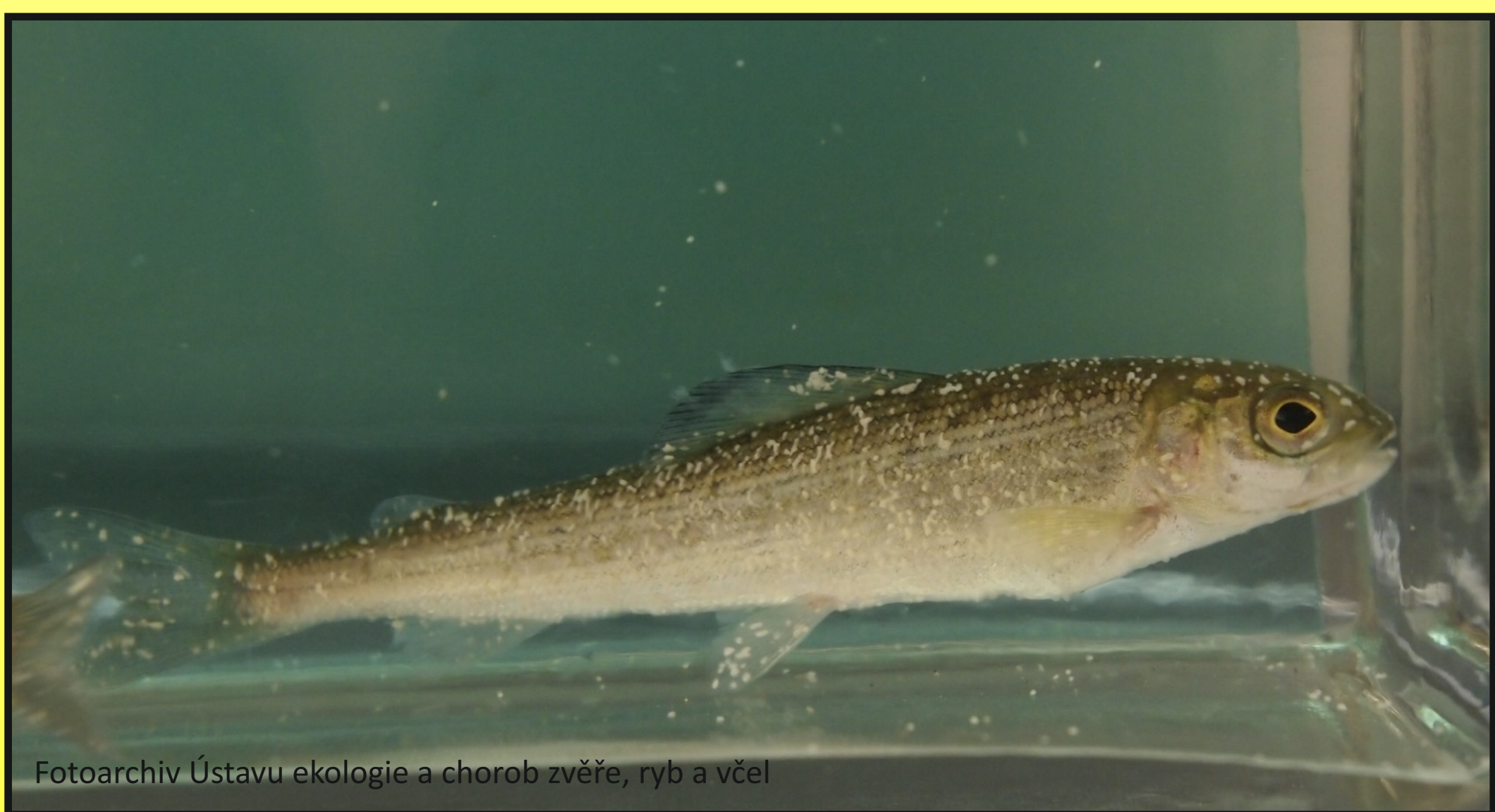
Obr. 1. Bílé tečky na kůži lipana podhorního, tzv. "krupečka"