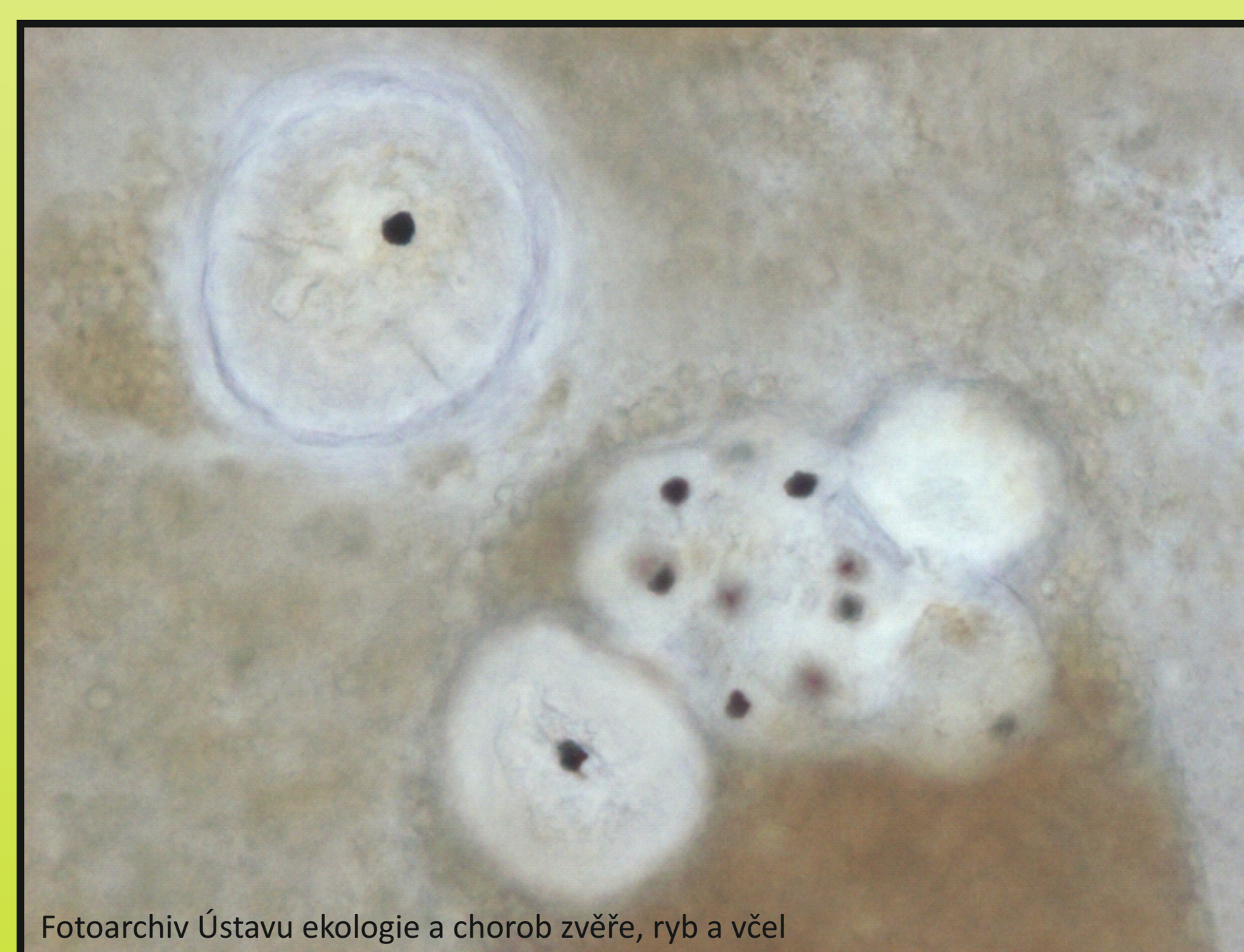
Obr. 2. Mikroskopie: Sanguinicola sp. v játrech