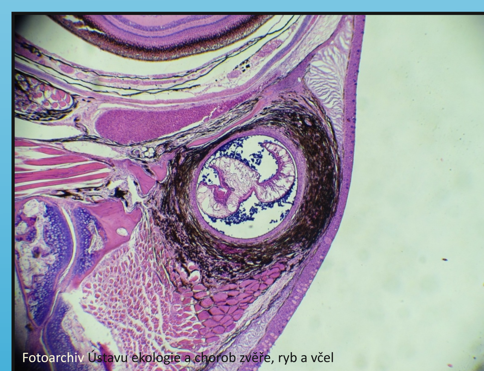
Obr. 3. Histologie: Posthodiplostomum cuticola - opouzřené metacerkarie, v okolí pigmentace