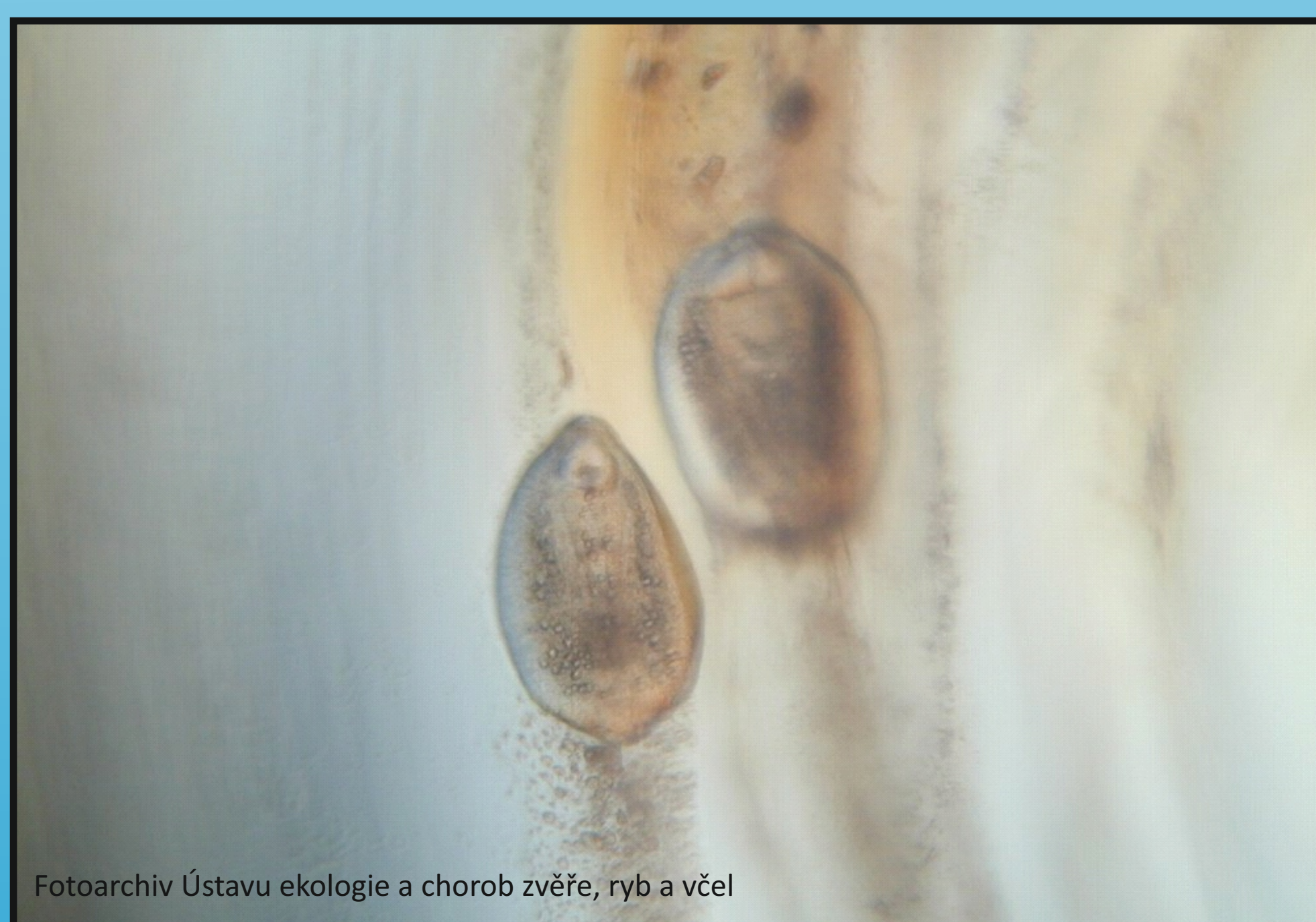
Obr. 1. Mikroskopie: Diplostomum spathaceum - metacerkarie v čůčce