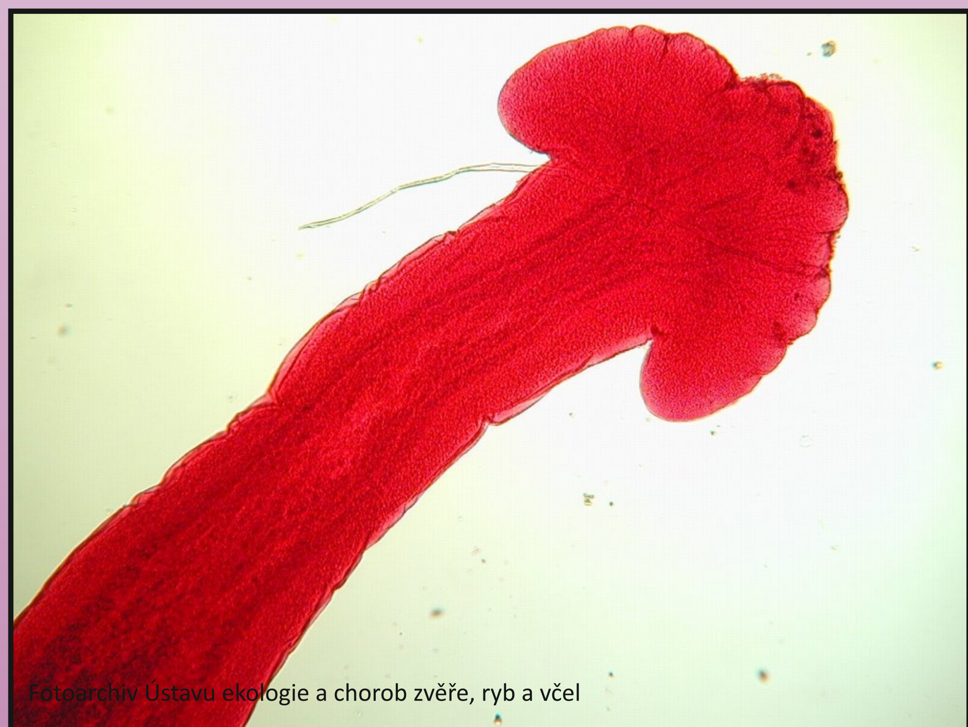
Obr. 1. Mikroskopie: Caryophyllaeus fimbriceps