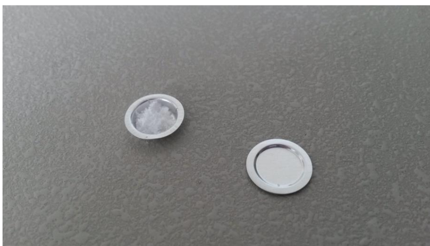
Obrázek 2: Pánvička naplněná vzorkem