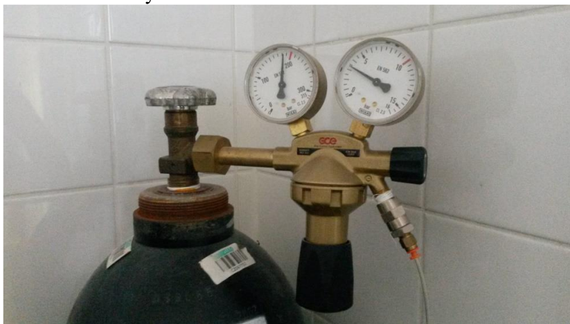
Obrázek 1: Redukční ventil na dusíkové lahvi

3) Otevře se přívod plynu, konkrétně dusíku. Při každém měření je nutné, aby množství přiváděného plynu bylo stejné, například vždy 3,5 baru, proto se nenastavuje jiný tlak, pouze se otevírá/uzavírá ventil znázorněný na obr. 1.