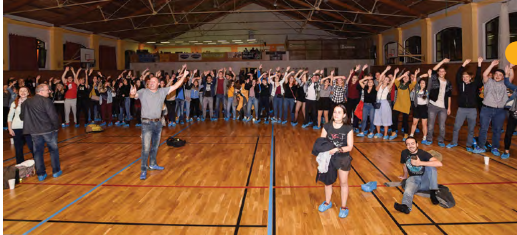
Na koncertě byla skvělá atmosféra