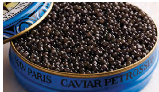
Vyhlášený kaviár Petrossian

Poslední kapitoly knihy se věnují opravdovým gurmánským specia-