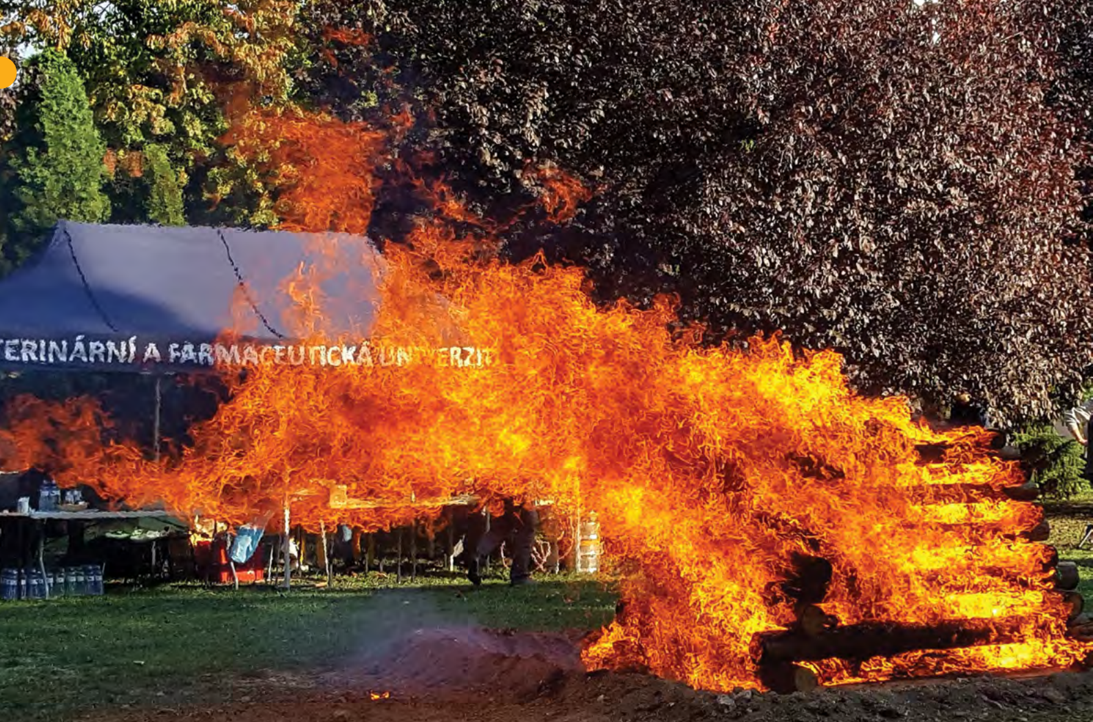
Vítr z plamenů slavnostní vatry vytvářel řadu obrazců