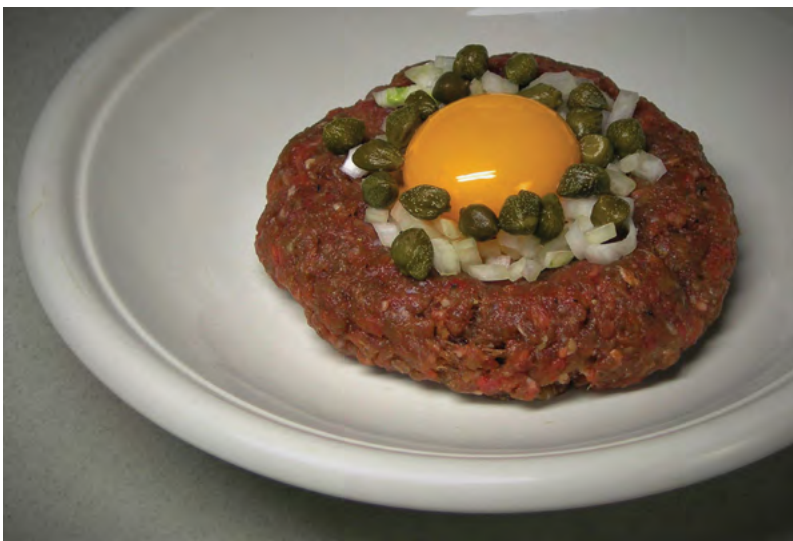
Domácí tatarák oživený kapari