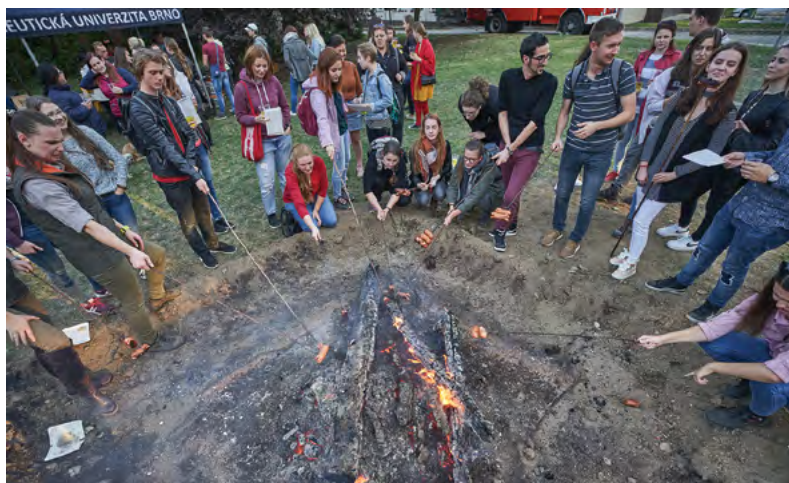
Opékání špekáčků na Open air party v areálu univerzity

text: Jiří Chodníček