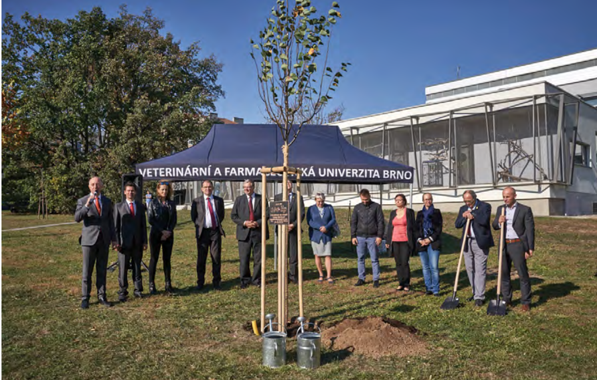
Výsadba lípy k výročí založení univerzity