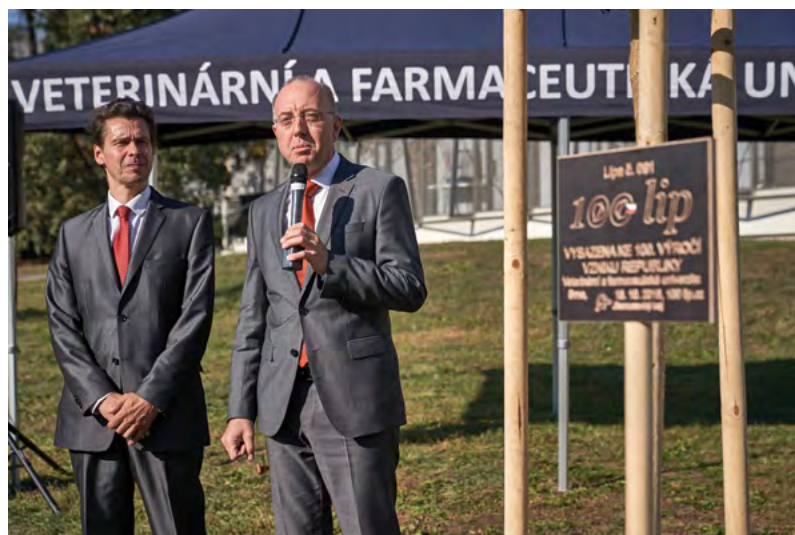
Rektor zahajuje na univerzitě výsadbu lípy č. 91 v rámci akce JmK 100 lip