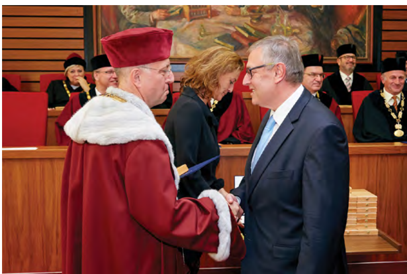
Medaili obdržel také Ústřední ředitel SVS ČR