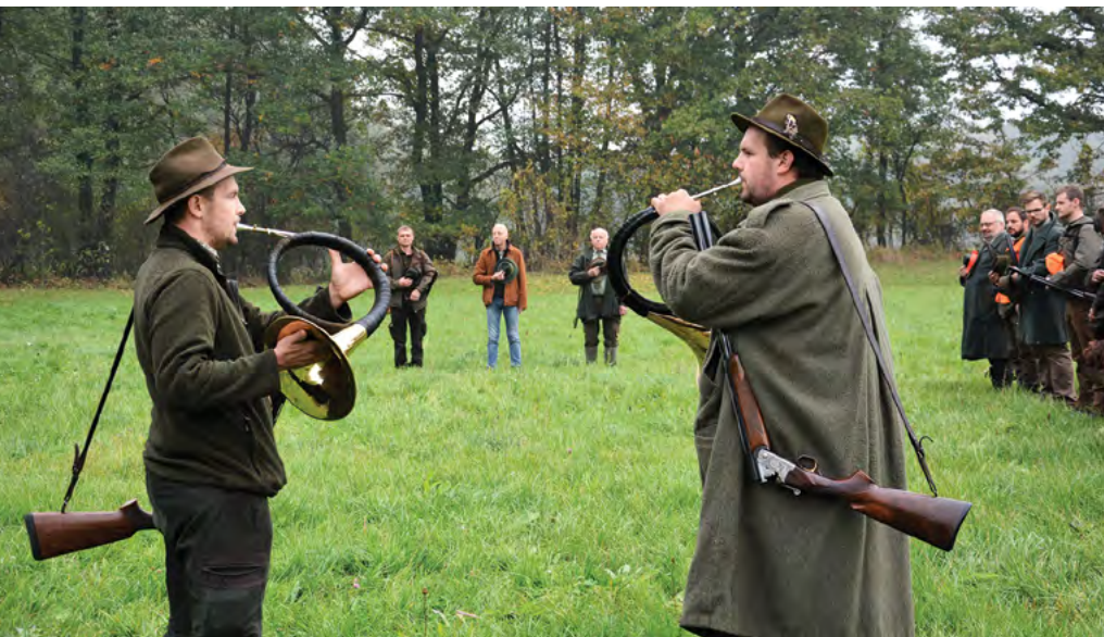
Slavnostní zahájení honu

V rámci stého výročí založení Veterinární a farmaceutické univerzity Brno rektor VFU uspořádal na závěr týdne oslav tradiční výukový hon, na kterém se setkali příznivci myslivosti v honitbě Školního zemědělského statku na Novém Jičíně.