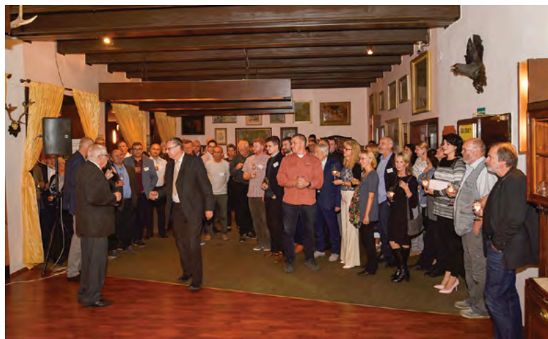
Zahájení společenského setkání v rámci konference Drůbež 2018

Ve dnech 12. – 14. 9. 2018 proběhl na Farmaceutické fakultě 47. ročník tradiční konference Syntéza a analýza léčiv, která se postupem let stala mezinárodním setkáním pracovníků a studentů nejen z farmaceutických fakult v Brně, v Hradci Králové a Bratislavě, které se každoročně střídají v jejím pořádání. Letos se organizace ujal Ústav chemických léčiv FaF VFU Brno. Na konferenci se sešlo 68 účastníků celkem ze 7 zemí. Své vědecké příspěvky ve formě posterů či prezentací představili kromě českých a slovenských kolegů i účastníci z Polska, Slovinska, Maďarska, Itálie a Ukrajiny. Celkem na konferenci vystoupilo 19 přednášejících, z toho 4 pozvaní a bylo prezentováno 42 po-