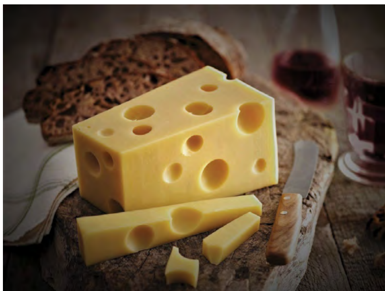
Ementál na stůl sváteční i páteční

V další části přechází potravinové pohledy na svět snad svou historií a bohatostí ještě neuvěřitelnější, svět tisíce let konzumenty vyhledávaný, obdivovaný a velebený, svět producenty v některých letech vychvalovaný a jiných zatracovaný, svět, který v pouhých dvou až třech barvách dokázal ve svém převážném pojetí přinášet skvělou náladu, lehkou mysl, úsměv a svolnost k společenskými konvencemi upíranému konání. Ano, další příběhy rozvíjí základy vína a světa s ním spojeným. A tak začíná další kolekce příběhů v kapitolách Po burgunsku, Barva jako víno, Šílené víno, Nejlepší marketing, Víno králů a král vín,