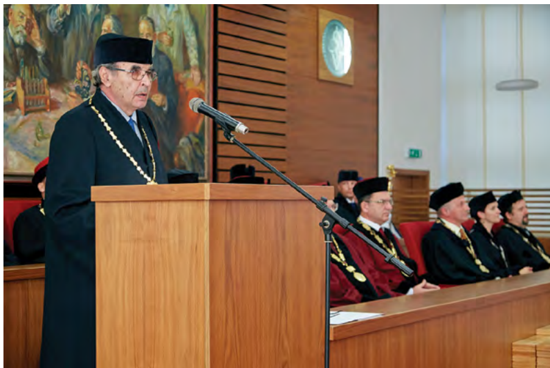
Předseda Akademického senátu při slavnostním projevu

Vaše magnificence, pane rektore, spectabiles, honorabiles, cives academici, vážení hosté, dámy a pánové,