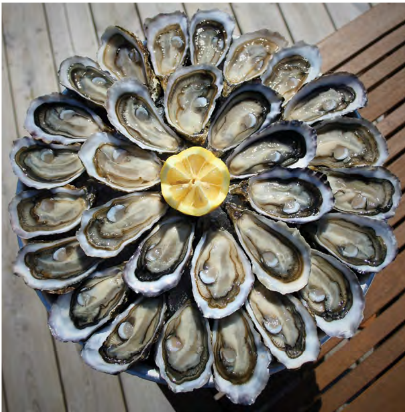
Mísa ústřic pro labužníky

sink, Sladká omáčka, Šlechtický původ. Tyto krásné příběhy potravin spojené s příběhy lidské důvtipnosti a cílevědomosti završují tematické vymezení knihy a směřují její záběr i na potraviny, o nichž se v jiných dílech nelze příliš dozvědět, nicméně je-