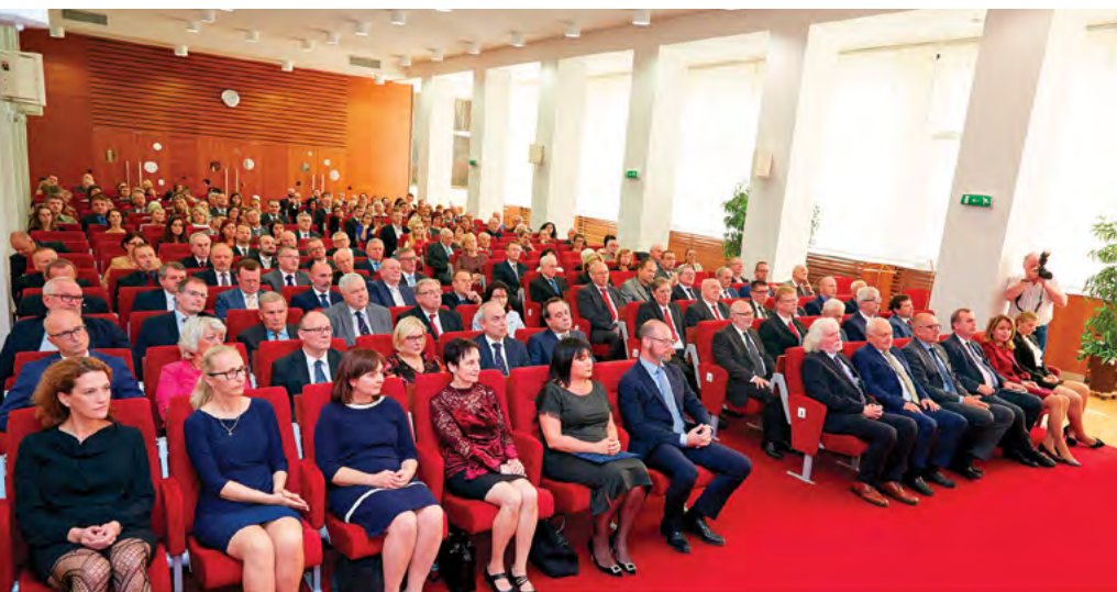
Při slavnostním shromáždění se zaplnila celá aula univerzity

tě SZÚ, členové Vědecké rady VFU Brno, Akademického senátu VFU Brno, Rady pro vnitřní hodnocení VFU Brno, Správní rady VFU Brno, Studentské rady VFU Brno, zástupci stavu profesorů, docentů, odborných asistentů, asistentů, zástupci zaměstnanců, a také studenti VFU Brno a další pozvaní hosté.