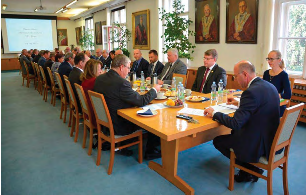
Slavnostní zasedání VR VFU