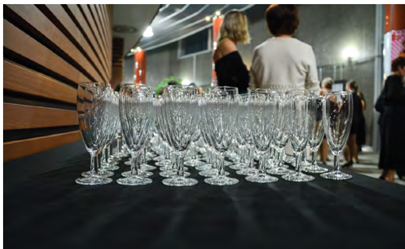
Po ukončení slavnostní předpremiéry byl připravován pro účastníky slavnostní přípitek