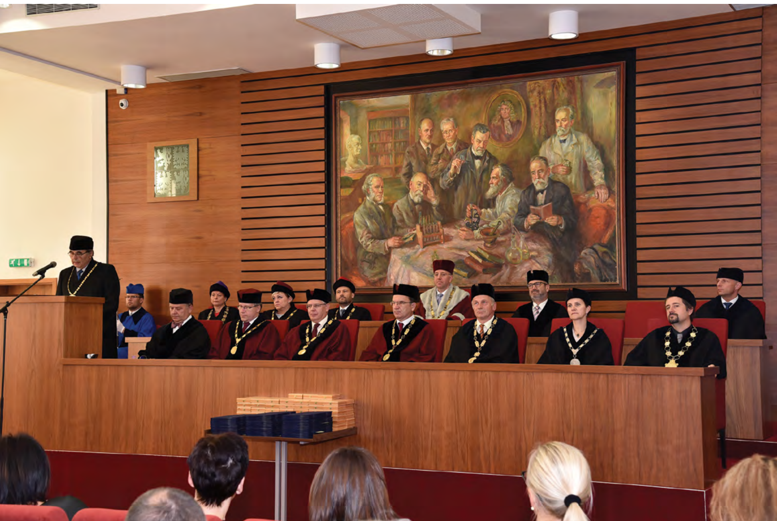
Předseda AS VFU zdůraznil význam akademické samosprávy na univerzitě

100 let v životě univerzity je mimořádné výročí, příležitost pro zamyšlení se nad historií alma mater, příležitost pro mimořádné setkání všech, kteří se podílí na současnosti naší vysoké školy, i těch kteří vytváří podmínky pro její vývoj v dalším období. Jsem rád, že univerzita využila této příležitosti, a připomíná svoji bohatou, napínavou, krásnou