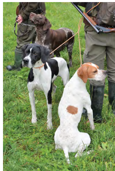
Doprovod potřebný na každém honu

Myslivecký večer tradičně nezahrnuje jen ocenění a vyhlášení krále a Diany honu, ale také výchovu k mysliveckým tradicím a disciplíně formou mysliveckého soudu s těmi účastníky, kteří se provinili proti mysliveckým zvyklostem. A tak bylo postiženo nedopatření v organizaci honu povinností zazpívat veřejně mysliveckou píseň, fotografování se v době vzdávání pocty ulovené zvěři povinností příspěvkem k zábavě účastníků mysliveckým vtipem, telefonování v době po zahájení začátku leče povinností tanečního sóla s Dianou honu a opomenutí v rozšíření loveckých zážitků na honu o sokolnický lov povinností pantomimické ukázky přípravy k lovu, vzletu, lovu a odevzdání kořisti sokolem lov-