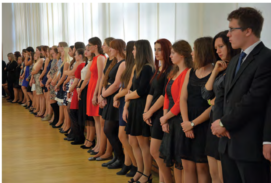
Studenti se připravují na převzetí imatrikulačního listu