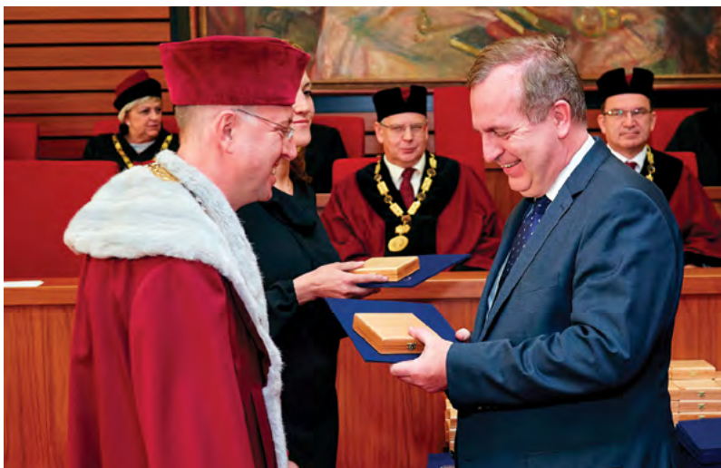
Rektor udělil medaili předsedovi ČKR