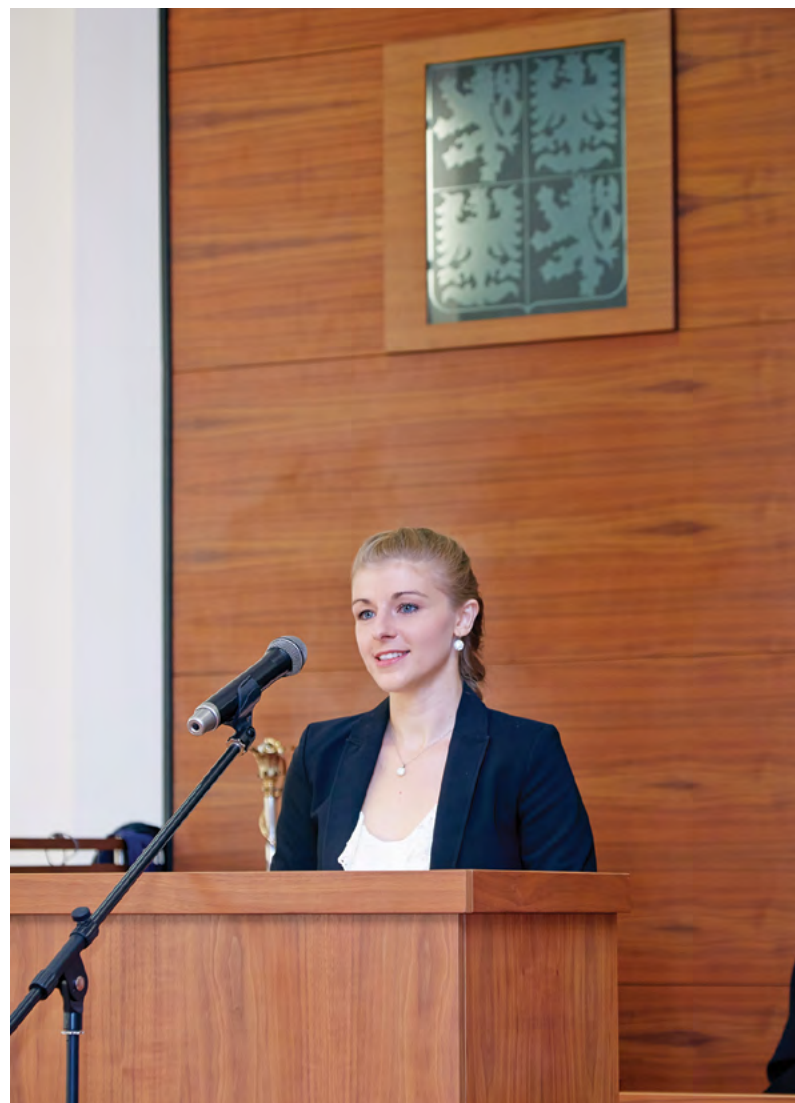
Projev zástupkyně studentů

Za studenty bych chtěla říci, že společně se svými profesory, docenty a dalšími učiteli sdílíme radost z úspěšného rozvoje naší vysoké školy, z dnešního postavení jedinečné, významné a společensky atraktivní univerzity, z krásného akademického prostředí, unikátního vybavení a svým posláním nezastupitelné univerzity, prostě – z mimořádné současnosti naší alma mater.