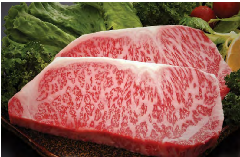
Tento roštěnec wagyu bude jistě jemný jako máslíčko

Autor, známý svými úžasnými knihami o mase, se zde věnuje tomu, co je jeho životním posláním, masu, masným výrobkům a specialitám, které s touto dobrodružstvím naplněnou potravinou souvisí. Jednotlivé tóny zajímavostí propojující světové poznání o mase se zde slévají do díla koncertního virtuosa, jež představuje své nejoblíbenější dílo. Profesionální znalosti, zkušenosti literáta a především unešení oborem mohou vytvořit základ pro tak opravdové a svou podstatou neobyčejně zajímavě podané příběhy ze světa masa v jeho dalších souvislostech; jedná se o kapitoly Maso do arktické zimy, Argentinský steak, Roastbeef, Halal nebo košer, Císařské hovězí, Vojenská