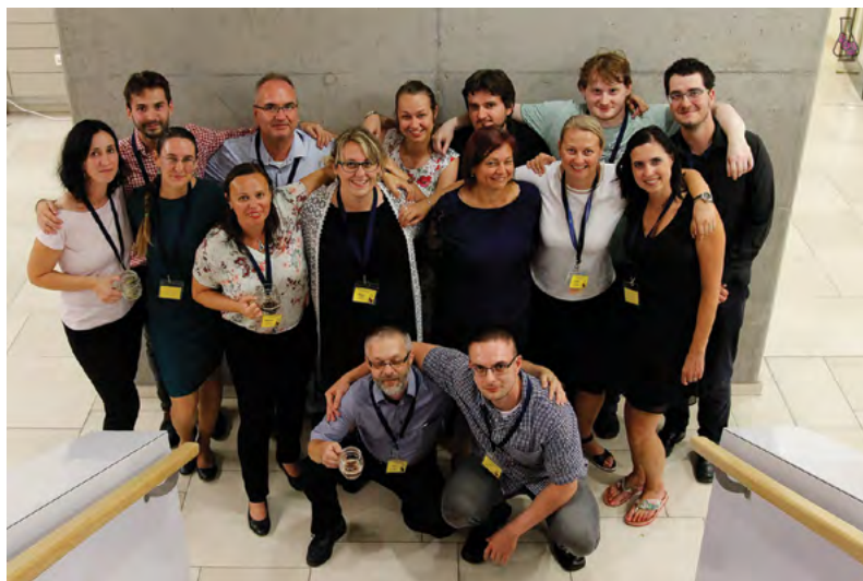
Organizační tým konference Ústavu chemických léčiv

V posluchárně Pavilonu prof. Lenfelda se 23. 11. 2018 konal 11. ročník konference určené určena pro prezentaci výsledků vědecko-výzkumné a tvůrčí aktivity studentů bakalářských a magisterských studijních programů, kteří zde již pravidelně prezentují výsledky svých kvalifikačních prací. V diskuzích na zajímavá prezentována témata tak studenti mnohdy poprvé veřejně obhajují své teze a hypotézy, což vede k dobré přípravě na vlastní závěrečnou obhajobu kvalifikační práce, a současně tak konference sdružuje