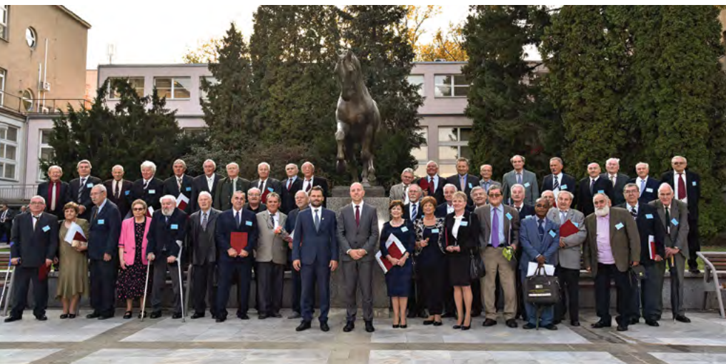
Absolventi univerzity po 50 letech od promoce