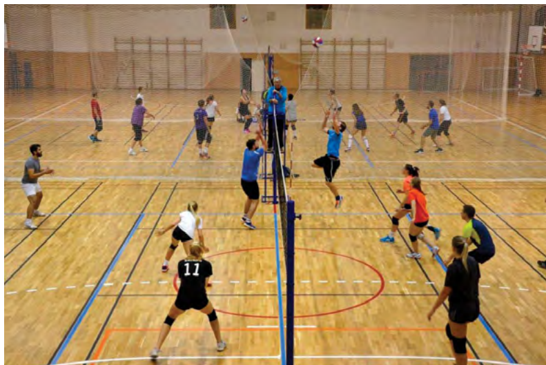
Sportovní soutěžení v hale univerzity

Na nové palubové podlaže sportovní haly se v tomto týdnu určenému sportovním soutěžím vystříдалo 410 studentů. V pondělí týdenní sportovní program zahájil badmintonový turnaj smíšených dvojic, na který navázal maraton v aerobiku. Týden sportu pokračoval ve středu turnaji ročníkových smíšených družstev ve frisbee a miniflorbalu. Sportovní týden zakončil volejbalový turnaj osmi smíšených družstev, která bojovala o Pohár rektora VFU Brno. Ten po dramatickém finálovém zápase získalo družstvo Hlboko nad vecou. Obdrželo ho na večerním slavnostním vyhlášení výsledků turnaje, na kterém účastníkům turnaje zahrála hudební skupina Kosí bratři.