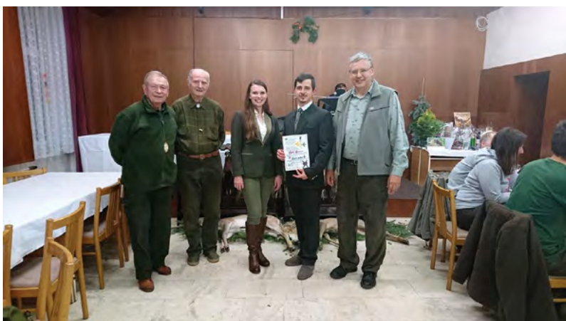
Král honu a Diana honu se soudní komisí