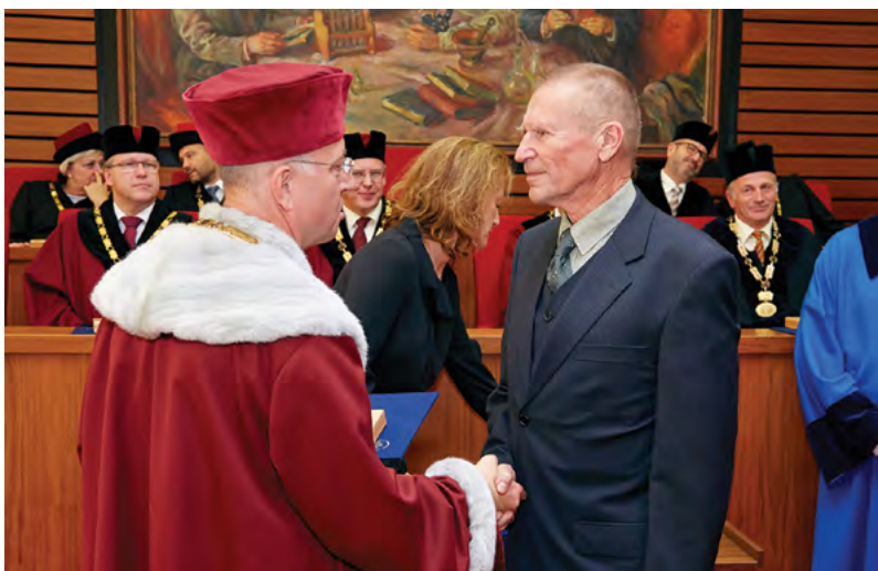
Medaile byla udělena také prezidentovi KVL

V další části slavnostního setkání úvodce oznámil, že rektor Veterinární a farmaceutické univerzity Brno rozhodl při příležitosti 100. výročí založení univerzity o udělení 100 medailí osobnostem z oblasti vysokého školství, tvůrčí činnosti, praxe a další spolupráce s univerzitou. Zlatá medaile univerzity byla udělena předsedovi ČKR, předsedovi RVŠ, ministru školství, mládeže a tělovýchovy, ministryni financí, ministru zemědělství, řídícím pracovníkům MŠMT, rektorům brněnských vysokých škol, řediteli SVS, řediteli ÚŠPS, ÚSKVBL, SZPI, ÚKZUS, prezidentovi KVL, prezidentovi ČLK, ředitelům některých spolupracujících nemocnic, řediteli Biovety, řediteli fy Steinhauer, majiteli časopisu Veterinářství a dalším osobnostem z řad členů vedení univerzity a fakult VFU Brno, Vědecké rady VFU Brno, Rady pro vnitřní hodnocení VFU Brno, Akademického senátu VFU Brno, Správní rady VFU Brno, profesorů a docentů FVL, FVHE a FaF a dalším.