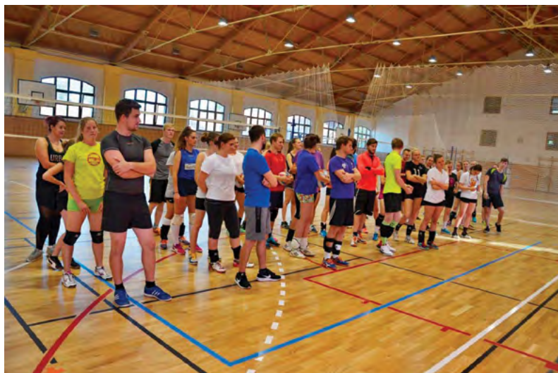
Účastníci týdne sportu