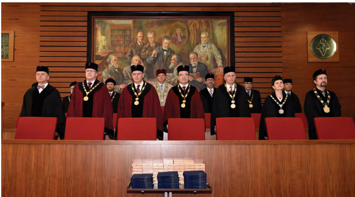
Předsednictvo slavnostního zasedání