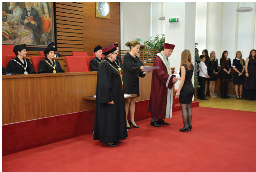
Rektor a děkanka fakulty předávají imatrikulační list