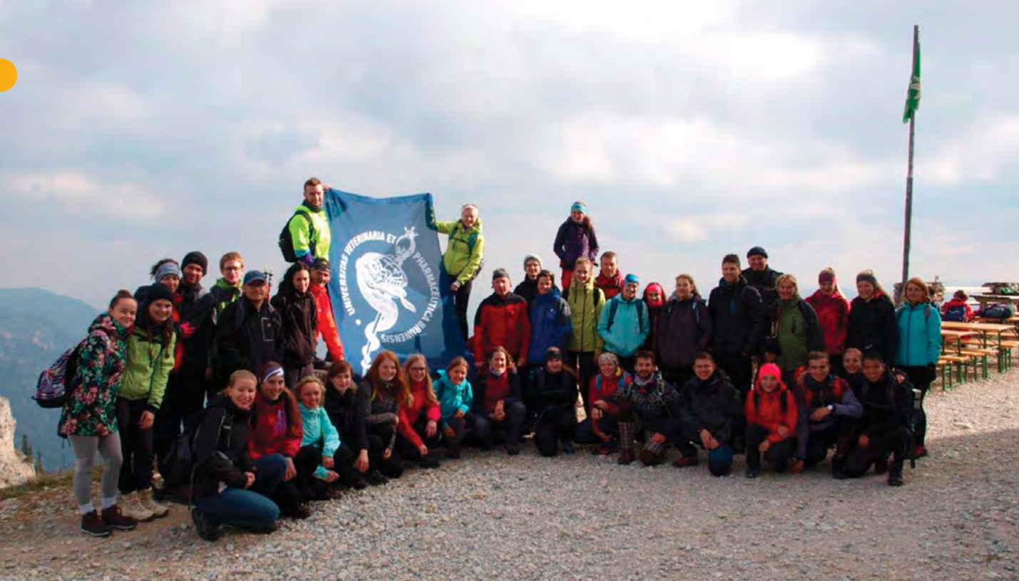
Výstupy na vrcholy v Alpách jsou tradiční součástí sportovních akcí VFU