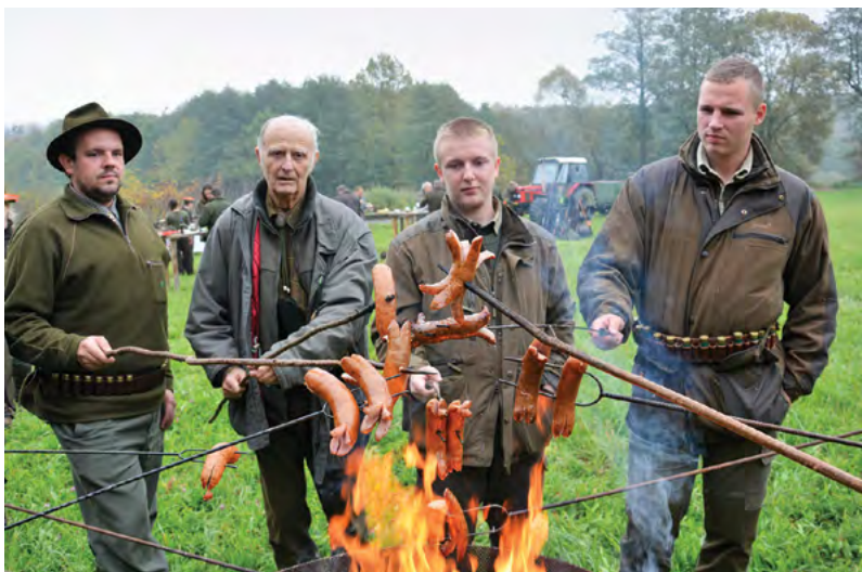
Nezbytné polední občerstvení na honu

tradiční večere zahrnující výborný bažantí vývar a neopakovatelnou kunínskou svičkovou na smetaně. A pak již večer směřoval k naplnění dalších mysliveckých tradic.