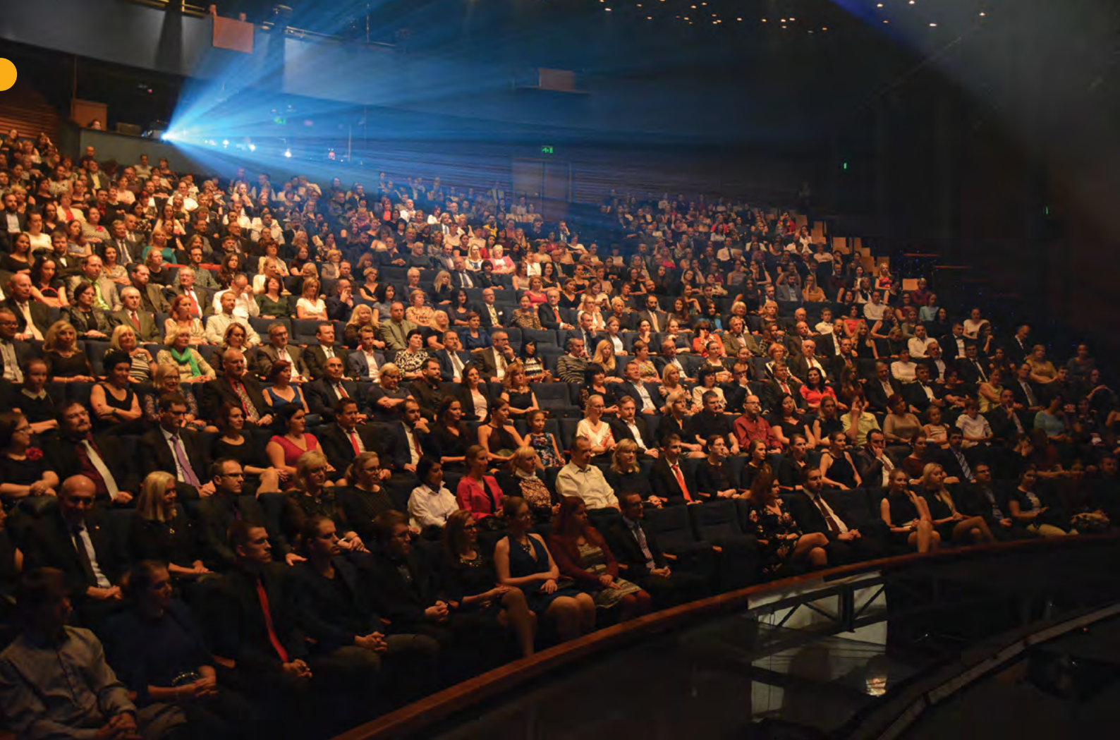
Akademičtí pracovníci, zaměstnanci univerzity a studenti zaplnili zcela hudební scénu Městského divadla v Brně