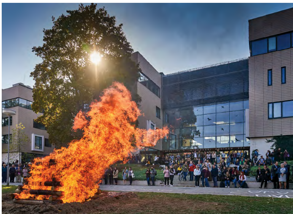
Symbolický obrazec koně ve skoku do druhého století existence VFU Brno

ní, hygienické i farmaceutické oblasti a pro další naplňování poslání veterinární, hygienické a farmaceutické profese.