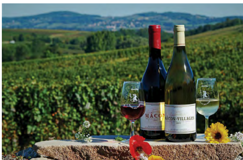
Burgundské víno stojí na Pinot noire a Pinot gris