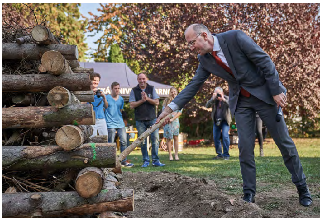
Rektor zapaluje slavnostní vatru

Počátek druhého století existence univerzity se stal skutečností. Společně tedy popřejme Veterinární a farmaceutické univerzitě, alma mater, akademickým pracovníkům, zaměstnancům, studentům i absolventům v dalším 100letém období rozvoj, úspěchy a přízeň osudu pro další naplňování poslání univerzity ve veterinární