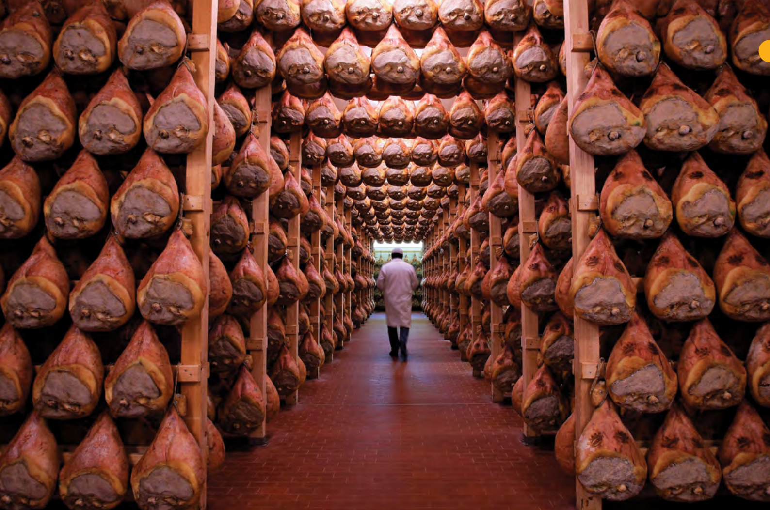
Navštivte les šunek v Parmě

vysoce konzumní svět, často vysoce vzdálen od skutečné gastronomie a potravinového umění, avšak pln podnikatelského úspěchu, přináší příběhy Králové chuti, Hamburger, Mr. Sandwich, Bystro bistro, Symboly Ameriky, Roztáhněte křídla.