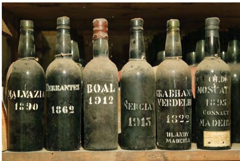
Výstava historických vín je součástí všech vinařství na Madeiře