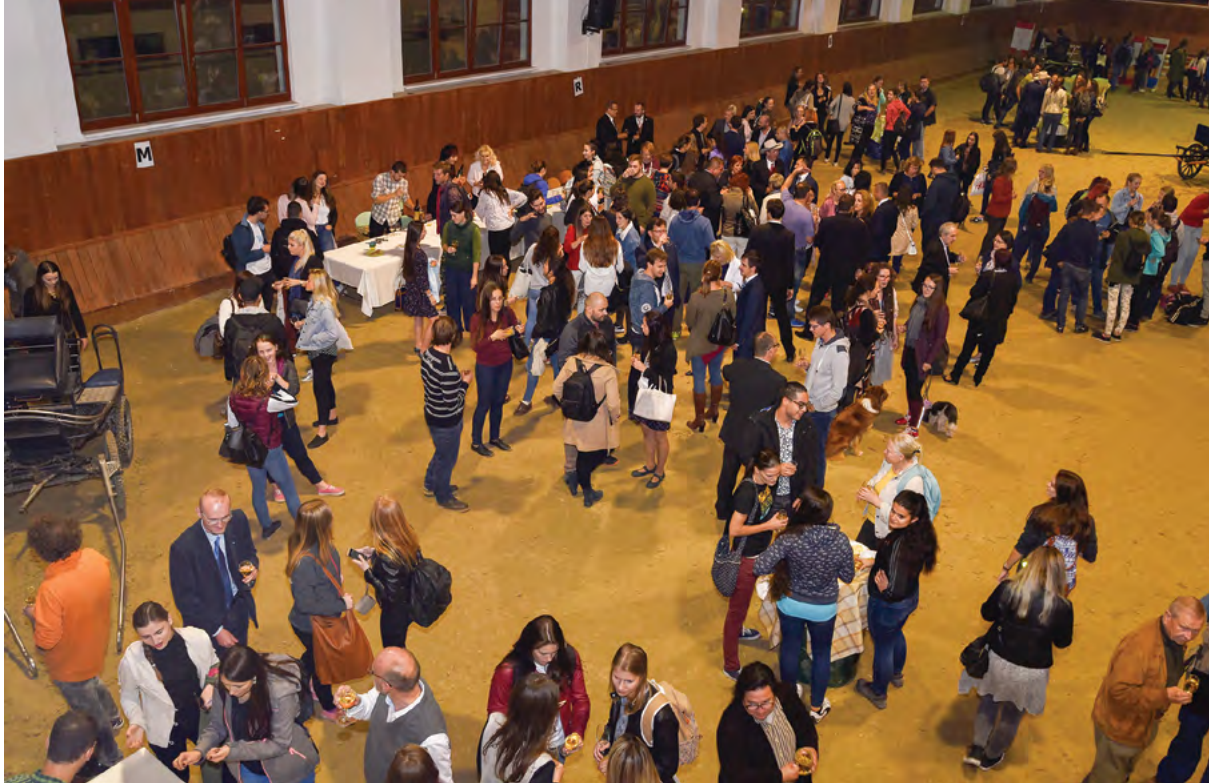
Univerzitní víno v jízdárně univerzity