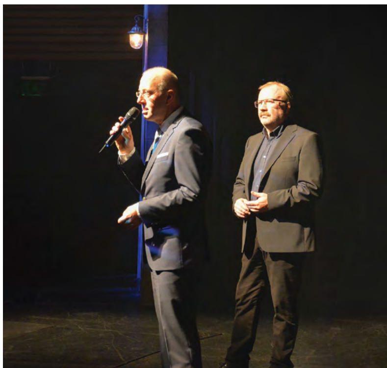
Rektor univerzity zahajuje divadelní představení uspořádané pro VFU Brno k jejímu výročí 100 let od založení

Závěr představení přinesl poděkování všem hercům dospělým i dětským od publika na úrovni „standing