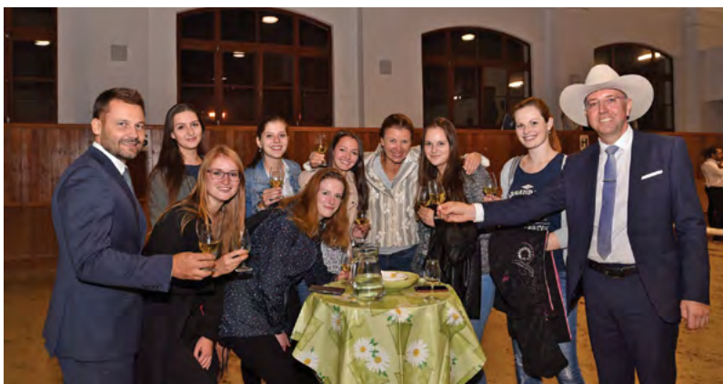
Členové akademické obce VFU Brno na vyhlášení univerzitního vína