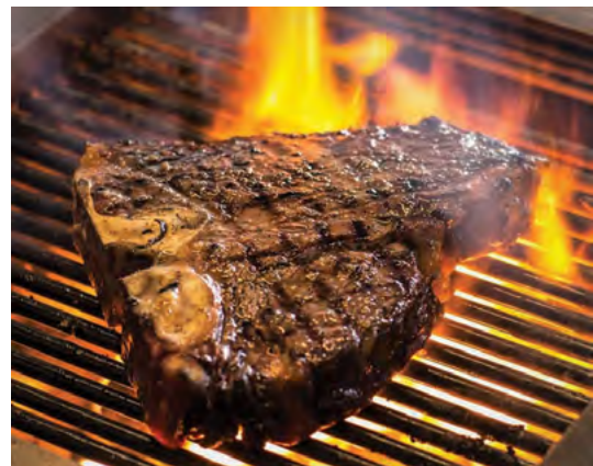
Zásada přípravy steaku je vysoká teplota grilu

Děj knihy však masem nekončí, přesouvá se na další metu, k potravinám, které v historii lidstva mají neobyčejný význam, svět ryb, rybích výrobků a mořských plodů je dalším ze světů, které svojí neskutečnou rozmanitostí a potravinovou možností uchvacují každého gurmána, jenž se, poháněn svojí vášní, vydává do tradičních i neobvyklých míst světové gastronomie a užívá lidské nápaditosti a vynalézavosti v přípravě, úpravě a požívání všeho, co sladkovodní i mořský svět přináší. Kapitoly Živé perly, Afrodita z lastury, Neuzený uzený, Silver Darlings, Kamaboko surimi, Kdo v tom má prsty jsou skutečnými