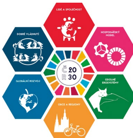
Strategický rámec Česká republika 2030 4

Strategický rámec Česká republika 2030 (ČR2030) 4 je koncepční dokument stanovující priority a cíle pro rozvoj České republiky do roku 2030. Rozpracovává výše uvedený dokument Cíle udržitelného rozvoje OSN z roku 2015 (SDGs) . Představuje hlavní oblasti, které jsou pro udržitelný rozvoj zásadní – lidé a společnost, hospodářský model, odolné ekosystémy, obce a regiony, globální rozvoj a dobré vládnutí.