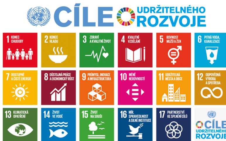
Cíle udržitelného rozvoje 2

Cíle udržitelného rozvoje (Sustainable Development Goals, SDGs ) 2 je program Organizace spojených národů na roky 2015–2030, který byl oficiálně schválen na summitu 25. září 2015 v New Yorku v rámci tzv. Agendy 2030 „Přeměna našeho světa: Agenda pro udržitelný rozvoj 2030“ (Transforming our World: The 2030 Agenda for Sustainable Development). Agenda 2030 představuje 17 hlavních oblastí, které by měly být transformovány.