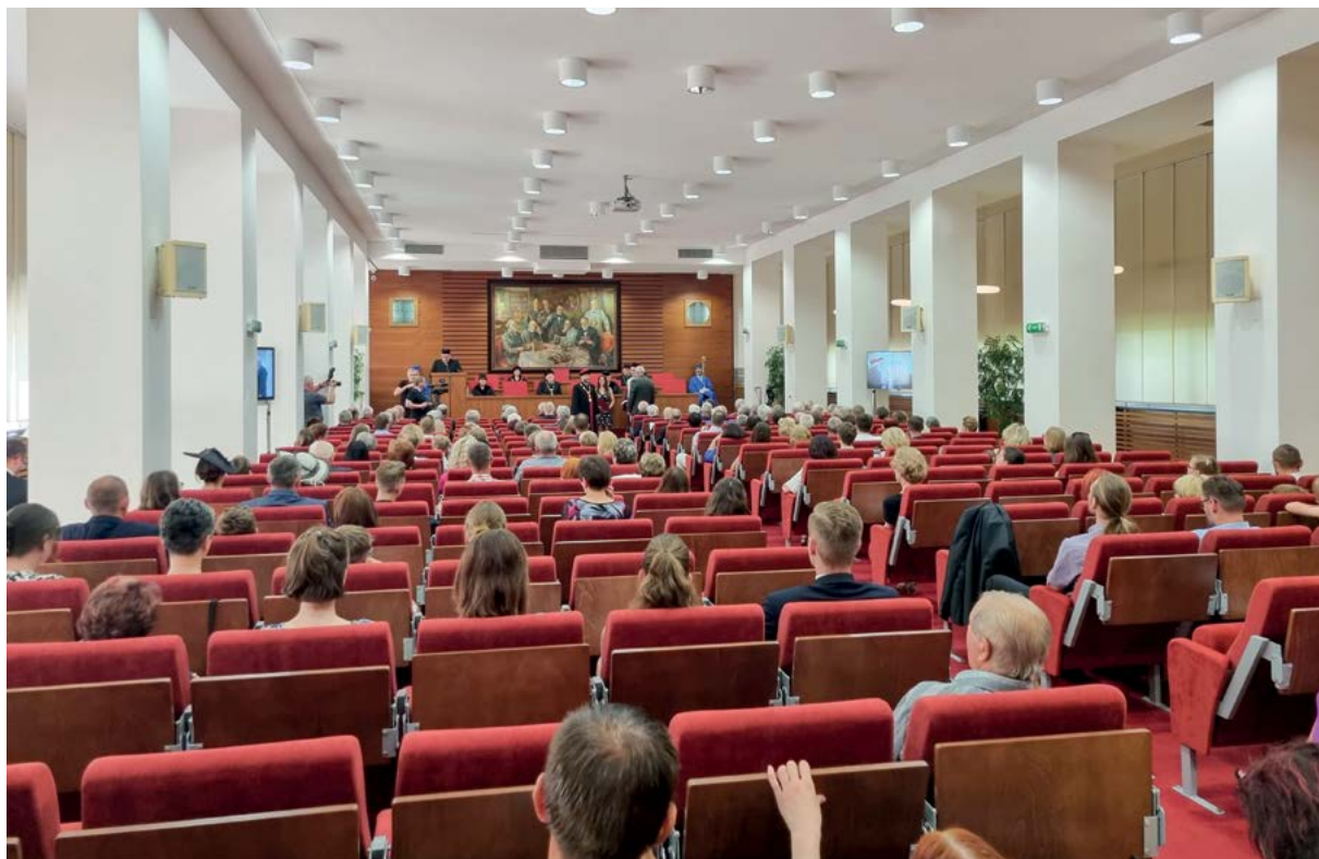
Zlaté promoce se konají v slavnostní aule univerzity