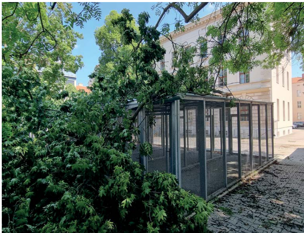
Vichřice způsobila pád stromu v areálu univerzity