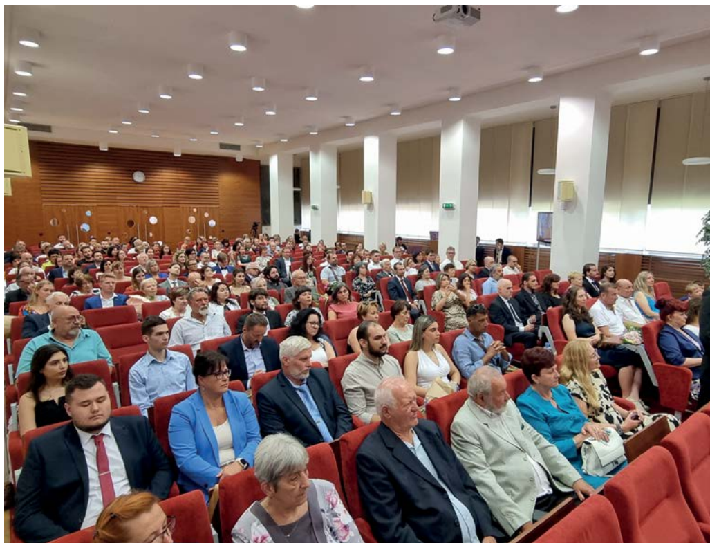
Slavnostní promoce se účastní nejbližší příbuzní, přátelé a známí absolventů