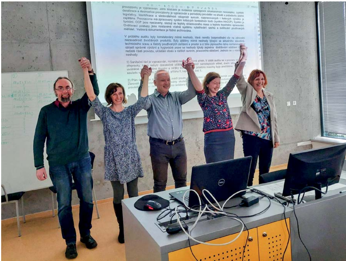
Kvalifikační vzdělávání k provádění auditů potravinářských podniků

řování volně žijící zvěře a prohlížení včelstev, kurzy pro seniory, kurzy pro akademické pracovníky a další zaměstnance k podpoře jejich kompetencí, schopností a dovedností a kurzy pro zájemce o studium na univerzitě.