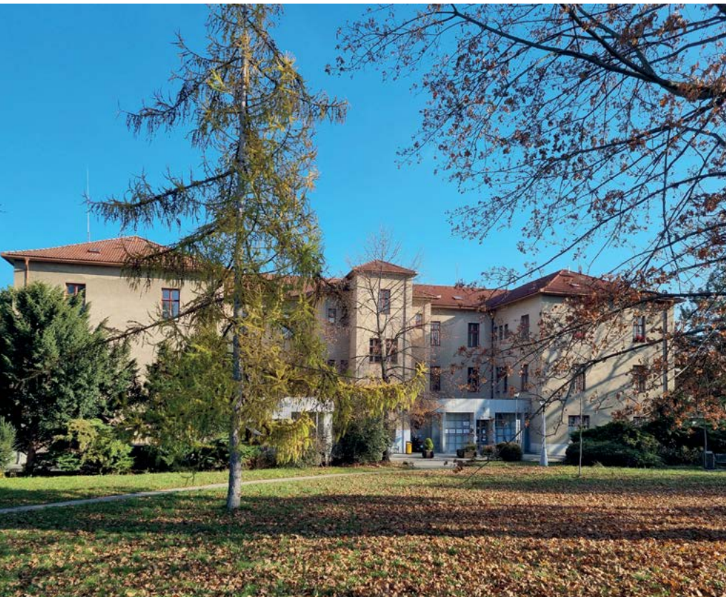
Mzdový předpis se vztahuje na celou univerzitu

Vedení univerzity vypracovalo, akademický senát univerzity schválil a ministerstvo školství, mládeže a tělovýchovy registrovalo nový mzdový předpis Veterinární univerzity Brno účinný od 1. 1. 2025.