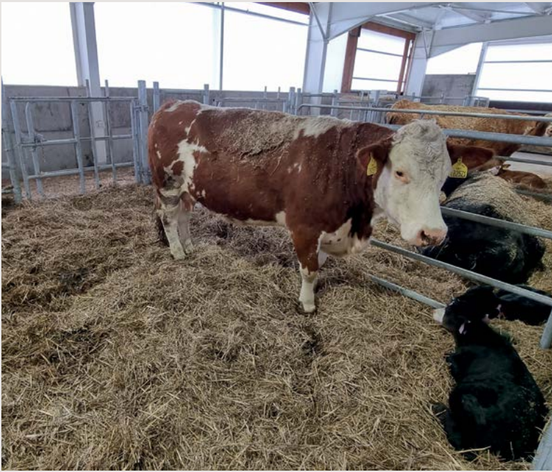
Obor choroby skotu, ovcí a koz – klinické vzdělávání I. stupně