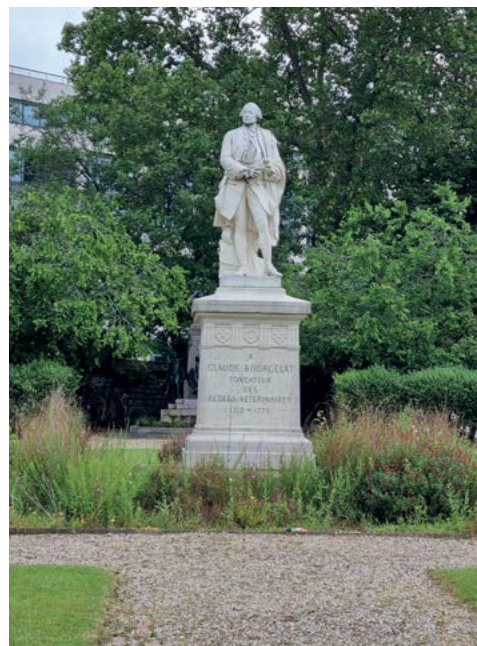
Socha zakladatele první vysoké školy veterinární na světě (v Alfortu) Clauda Bourgelata