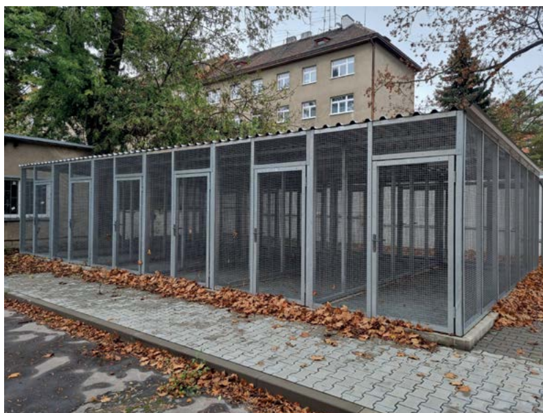
Zařízení pro výuku etologie zvířat