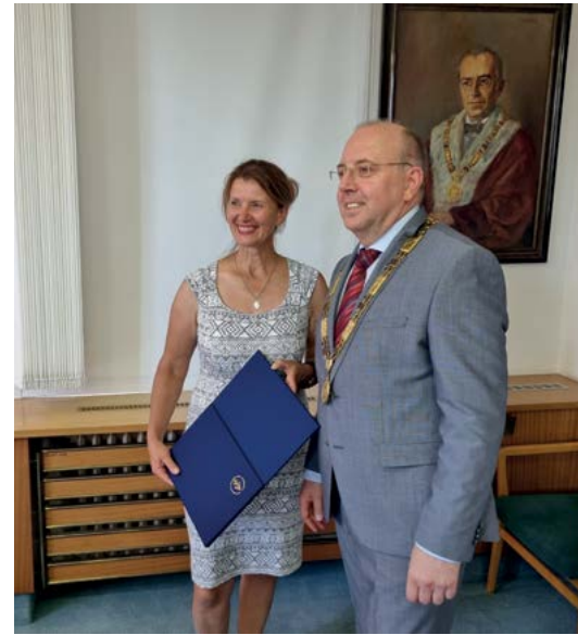
Osvědčení o získání I. stupně klinického vzdělání veterinárních lékařů předával absolventům rektor univerzity