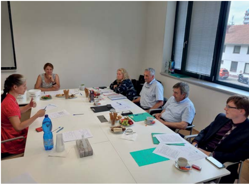
Zkouška v rámci Klinického vzdělávání I. stupně – choroby koní