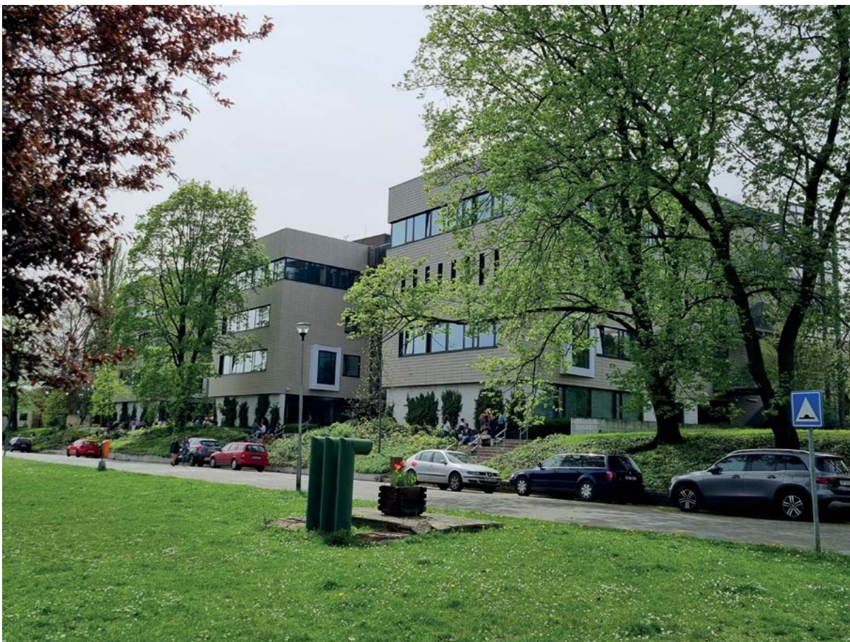
Institut celoživotního vzdělávání je umístěn v prostorách Studijního a informačního centra univerzity

gienu potravin, na bezpečnost a kvalitu potravin, na ochranu a dobré životní podmínky zvířat a na zdraví volně žijících živočichů a ochranu životního prostředí, případně na další oblasti odborného působení univerzity.