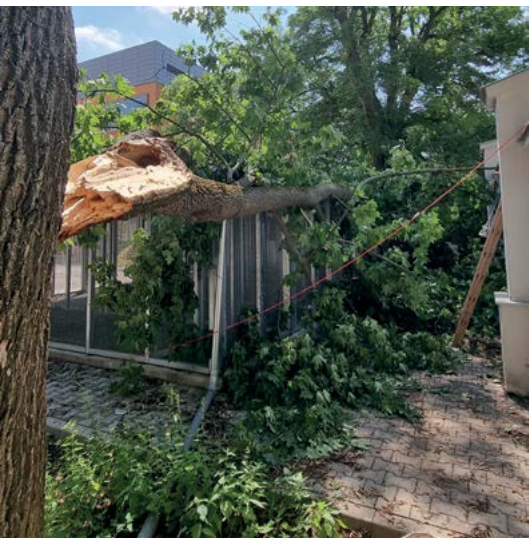
Na první pohled dopad vichřice působil poměrně dramaticky

Škody způsobené vichřicí se podařilo rychle odstranit