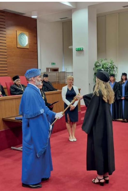
Slavnostní slib absolventa při jeho promoci