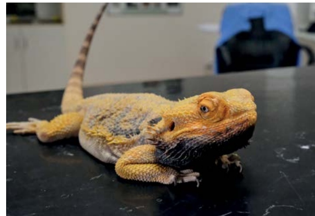
Obor choroby plazů, exotických ptáků a drobných savců – klinické vzdělávání I. stupně