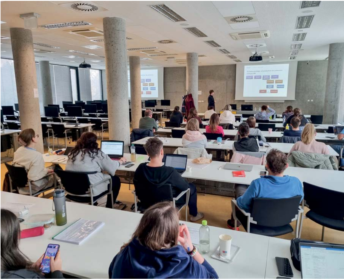
Součástí vzdělávací části je také problematika právní úpravy dozorové činnosti vykonávané v rámci veterinárního dozoru

účastníci podrobují závěrečné zkoušce. Její vykonání dává absolventům tohoto vzdělávání pracovní perspektivu dozorového pracovníka státní nebo krajské veterinární správy v oblasti dozoru nad ochranou zvířat a dobrými životními podmínkami pro zvířata. V roce 2024 se tohoto vzdělávání účastnilo prvních 6 pracovníků – inspektorů ochrany zvířat proti týrání.