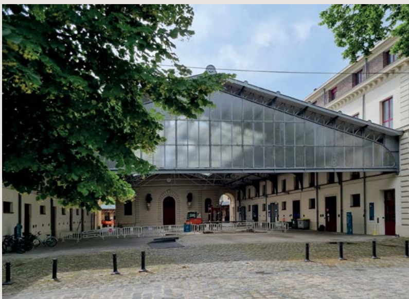
Veterinární fakulta v Alfortu – budovy klinik pro velká zvířata