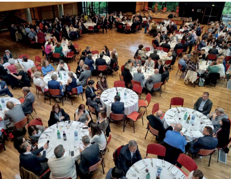
Společenské setkání na závěr zasedání EAEVE