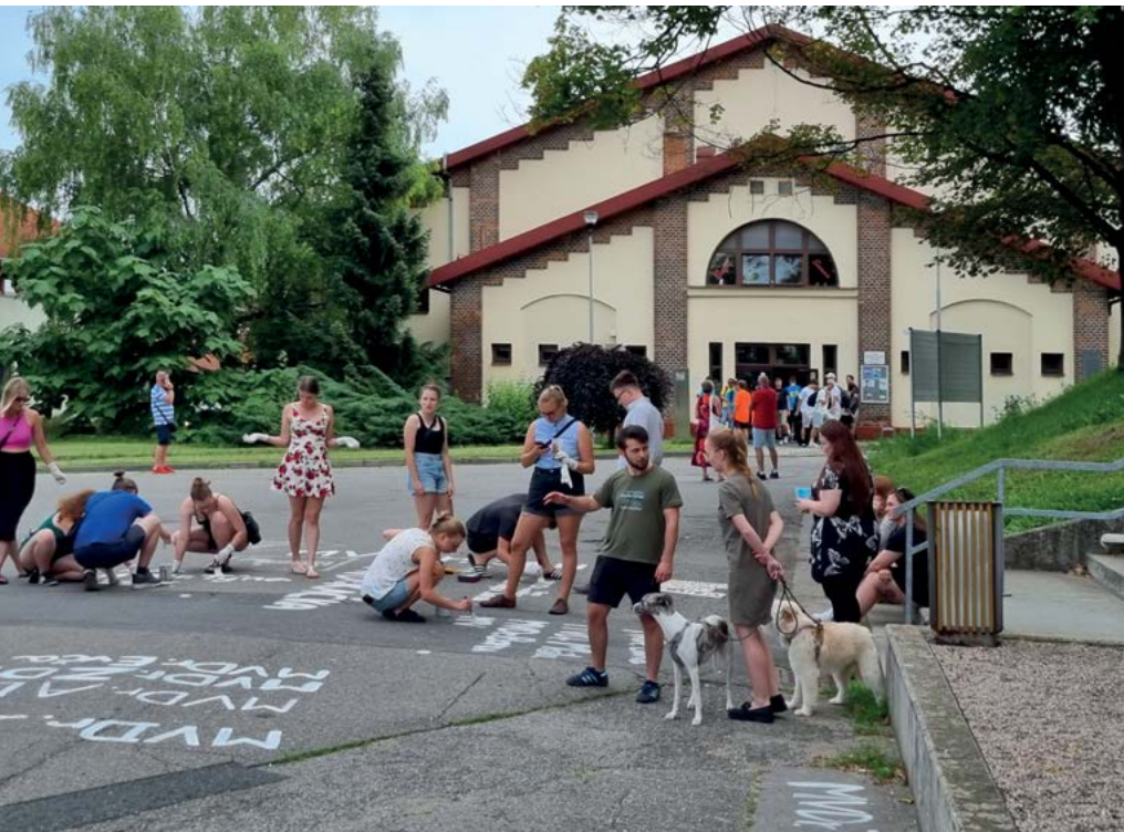
Absolventi před promoci zvěčňují svůj absolventský úspěch zápisem svého jména nebo přezdívky v areálu univerzity