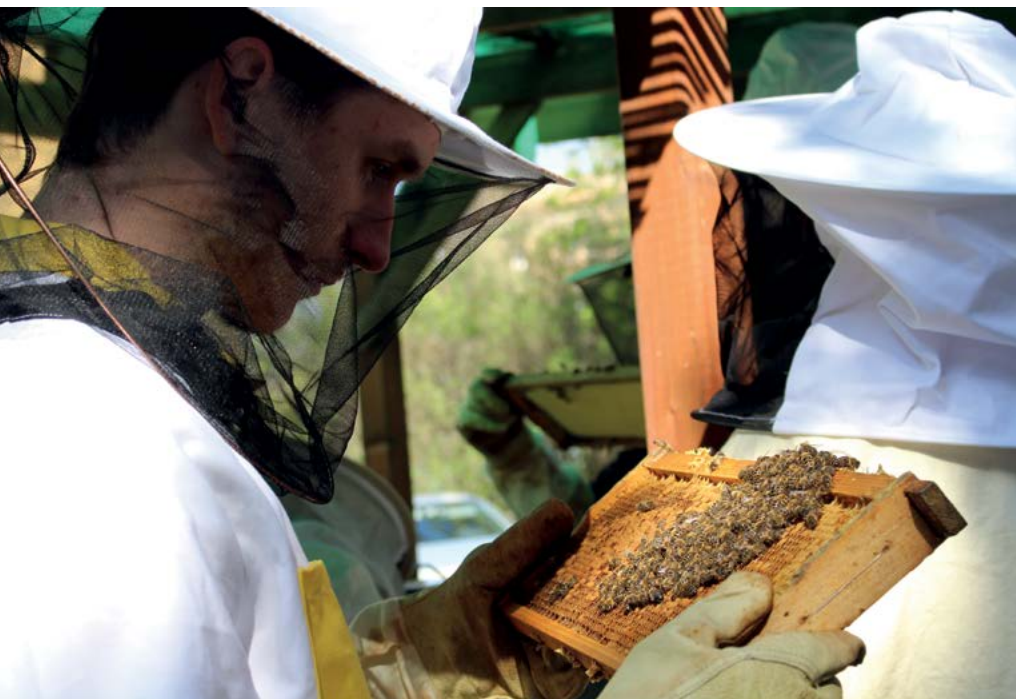
Prohlížeč včelstev – specializované školení

Na základě specializační zkoušky získávají účastníci Osvědčení o získání specializačního vzdělávání v ochraně zvířat proti týrání. Absolvent získává kompetenci pro samostatnou odbornou činnost inspektora v ochraně zvířat proti týrání.