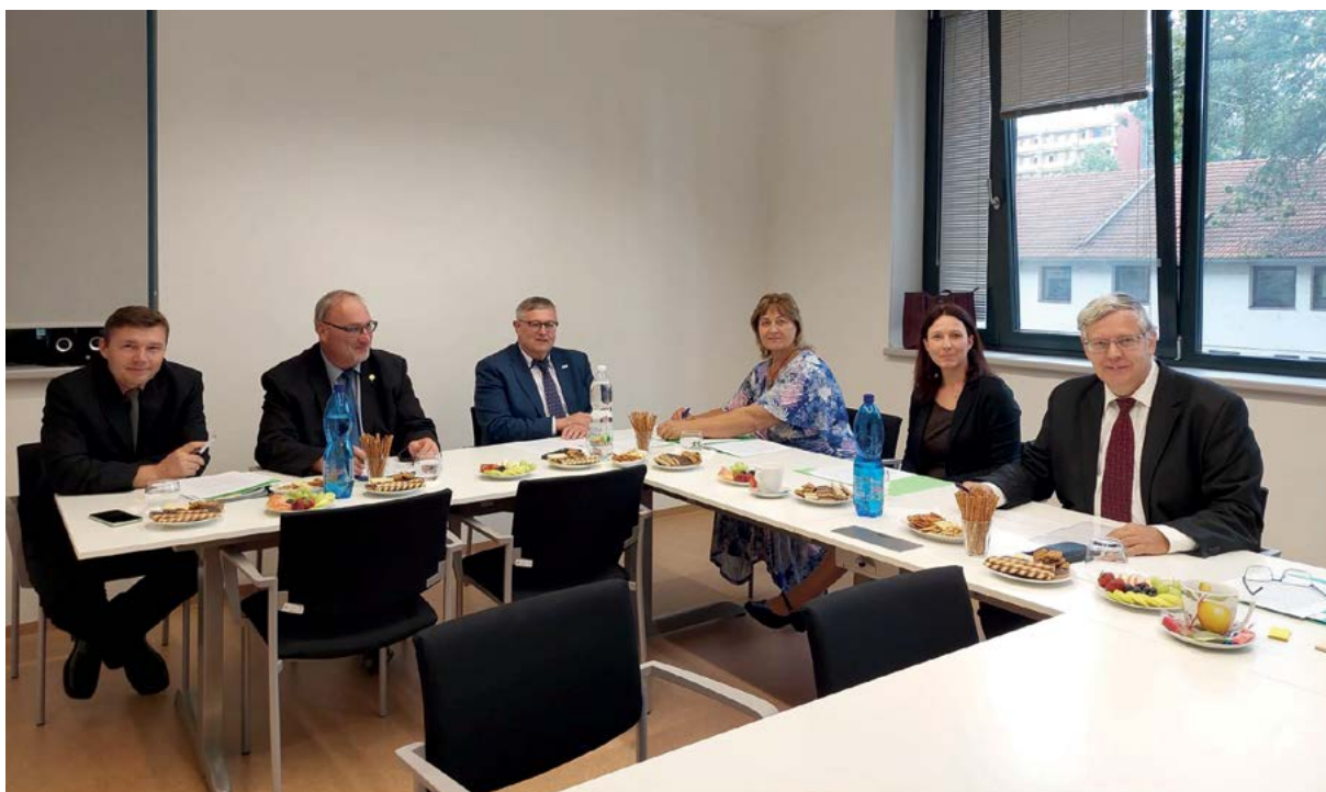
Zkušební komise pro atestační vzdělávání úředních veterinárních lékařů

Specializační vzdělávání pro inspektory ochrany zvířat proti týrání je určeno zejména absolventům navazujícího studijního programu Ochrana zvířata a welfare, kteří se stali pracovníky krajských veterinárních správ, anebo státní veterinární správy, a působí v dozorové činnosti zaměřené na ochranu a dobré životní podmínky pro zvířata. Problematika zahrnuje zejména právní úpravu ochrany zvířat, dobrých životních podmínek pro zvířata a pohodu zvířat, a to zejména z pohledu dozorové činnosti vykonávané orgány veterinární správy. Na závěr vzdělávací části zahrnující odborné přednášky na univerzitě a části zahrnující praktickou činnost v rámci pracovní činnosti nejčastěji na krajské anebo státní veterinární správě se