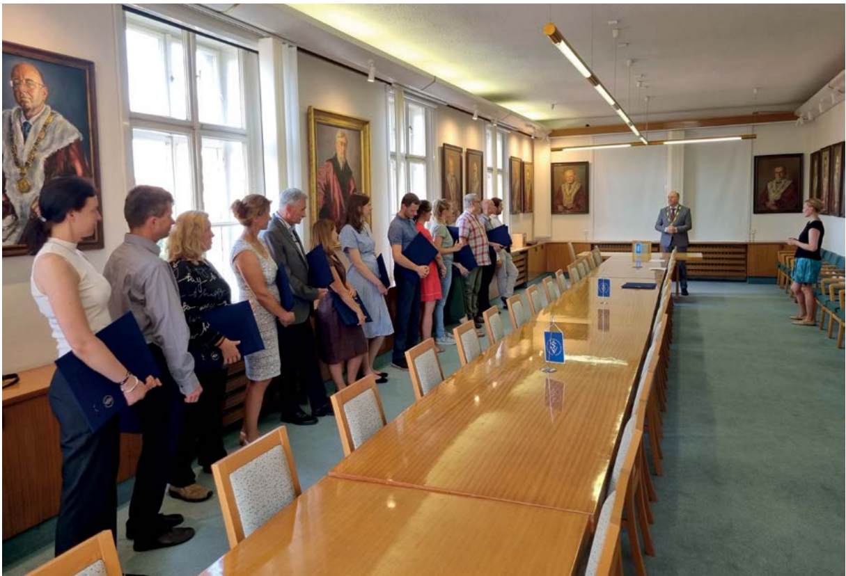
Předávání osvědčení o absolvování Klinického vzdělávání I. stupně