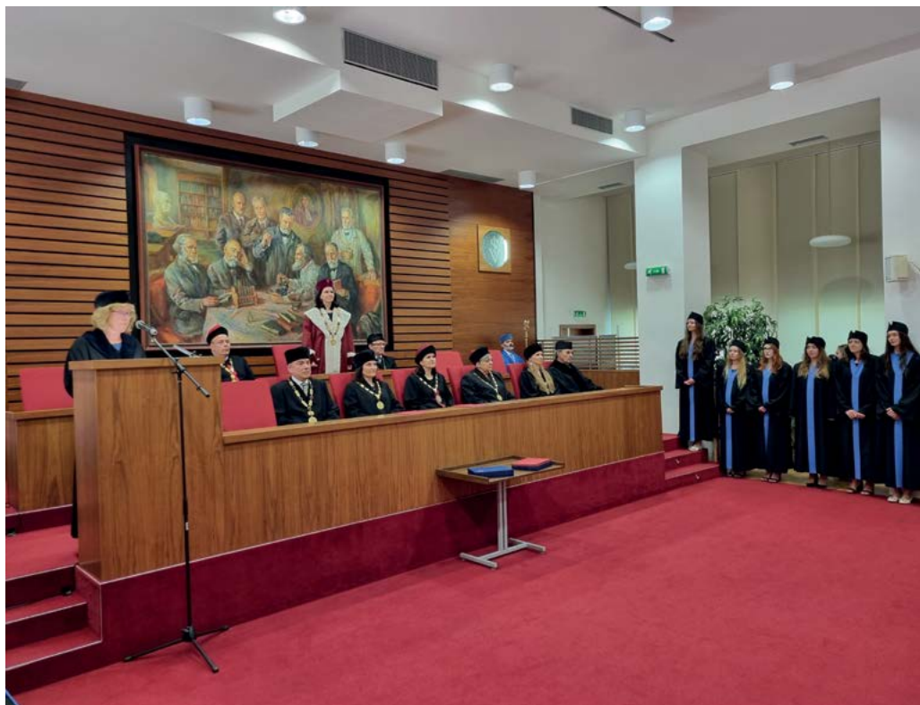
Absolventi nastoupení před vedením univerzity a fakulty při zahájení promoce