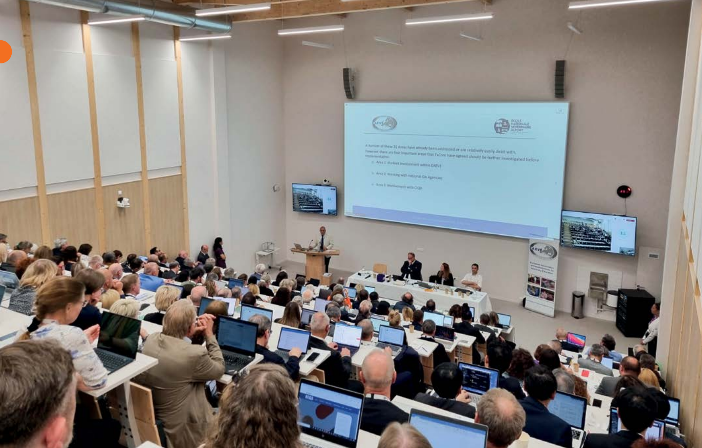
Zasedání Evropské asociace veterinárních fakult a univerzit v Alfortu (Francie)