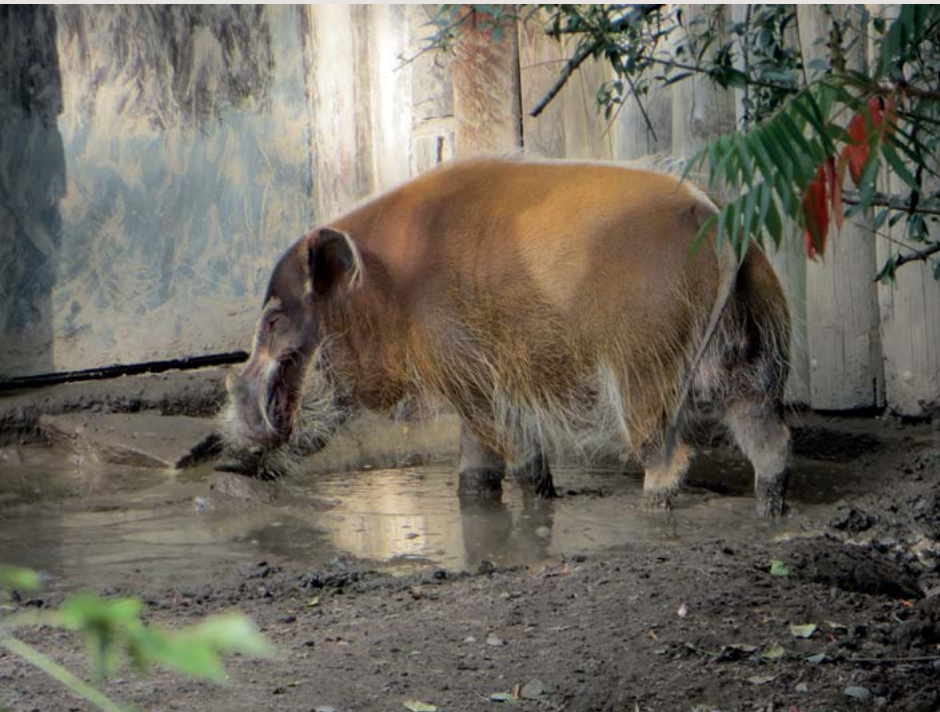
Obor choroby prasat – klinické vzdělávání I. stupně