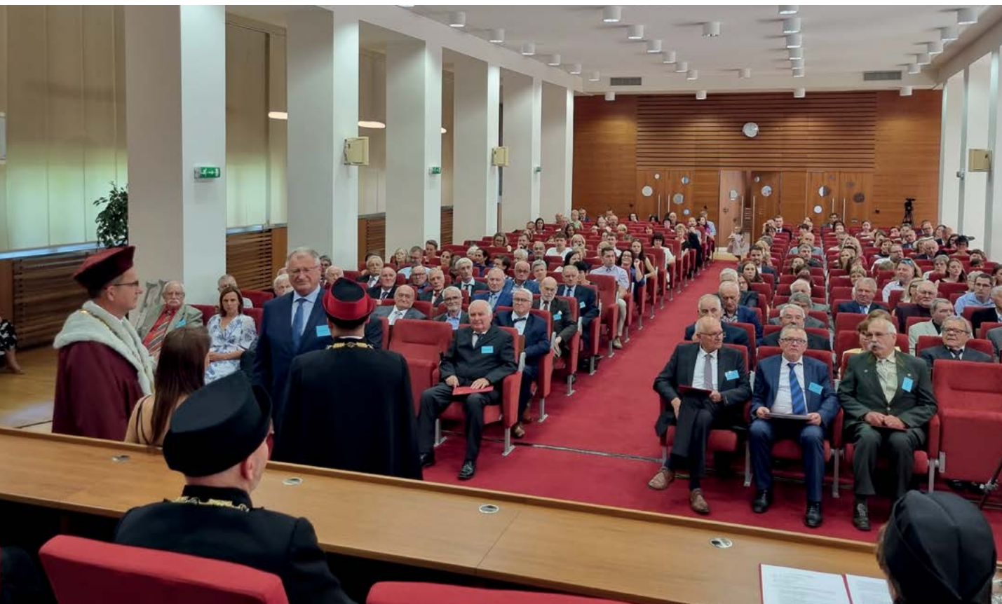
Předávání slavnostních zlatých diplomů prorektorem univerzity a děkanem fakulty