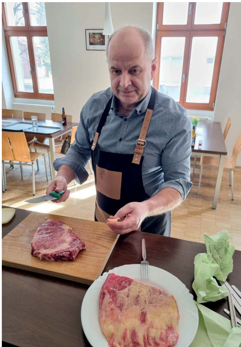
Univerzita třetího věku zaměřená na zdravotní nezávadnost potravin

ŠKOLENÍ VE VYŠETŘOVÁNÍ VOLNĚ ŽIJÍCÍ ZVĚŘE A PROHLÍŽENÍ VČELSTEV Školení dává kompetenci určenou právními předpisy pro vyšetřování ulovené zvěře prohlížeteli a nebo k prohlížení včelstev.