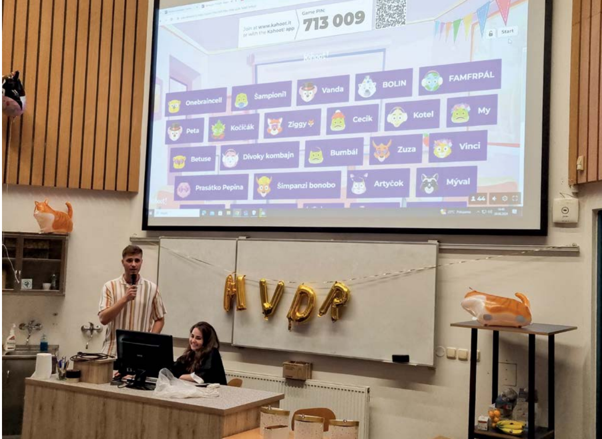
Závěrečné setkání studentů po státní zkoušce v roce 2024 zahrnovalo veselou znalostní soutěž pro přítomné