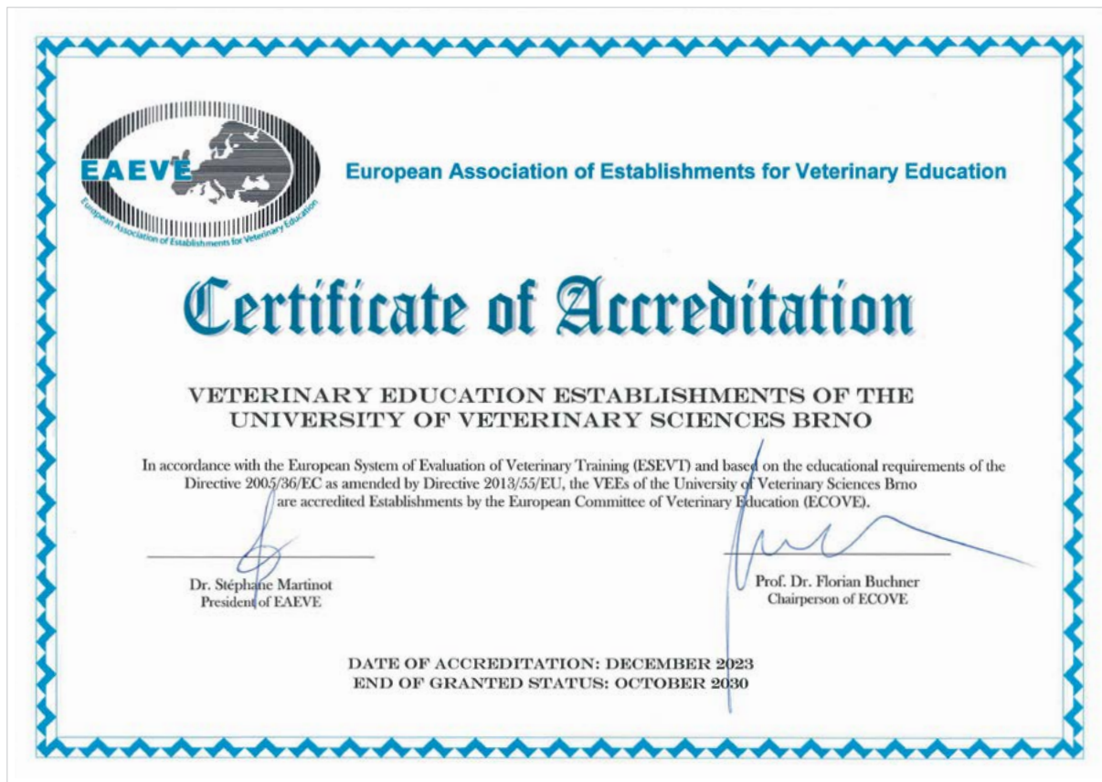
Certifikát o získání mezinárodní akreditace pro veterinární vzdělávání