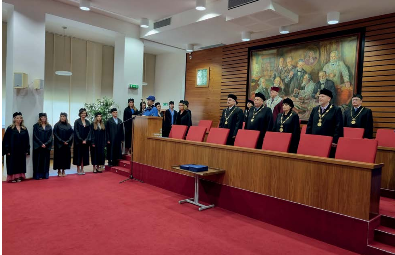
Slavnostní zahájení promoce absolventů doktorského studia na Veterinární univerzitě Brno