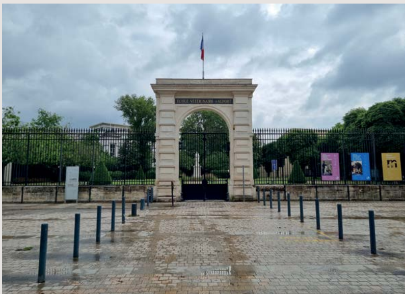
Vstup do areálu Veterinární fakulty v Alfortu