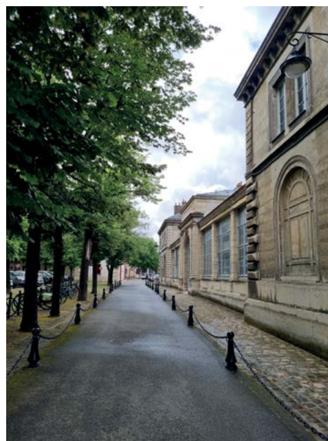
Budovy Veterinární fakulty v Alfortu zahrnují celé spektrum od historických až po moderní