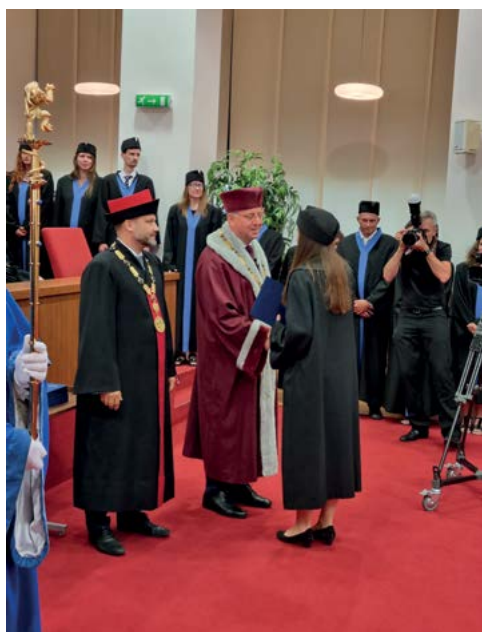
Předávání diplomu absolventům doktorského studia

Veterinární univerzita Brno realizuje doktorské studium v řadě studijních programů zaměřených do oblasti veterinárních věd.