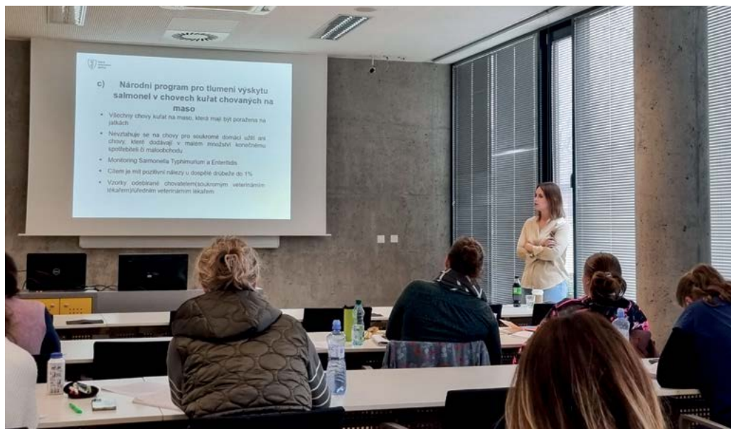
Přednášky pro účastníky atestačního vzdělávání zaměřené na problematiku epizootologie a nálezů