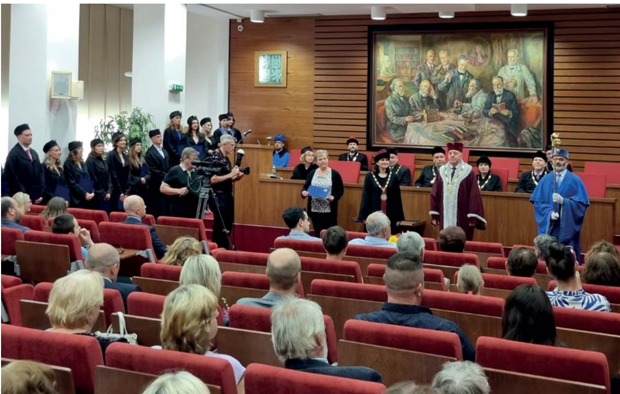
Předávání diplomů o absolvování doktorského studia z rukou rektora a děkana/nky příslušné fakulty