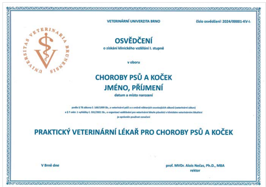
Osvědčení o získání klinického vzdělání I. stupně