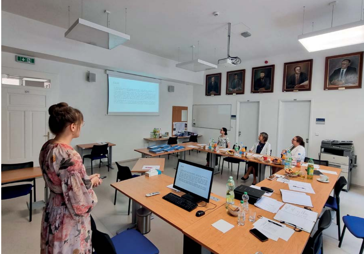
Obhajoba závěrečné práce před obornou komisí