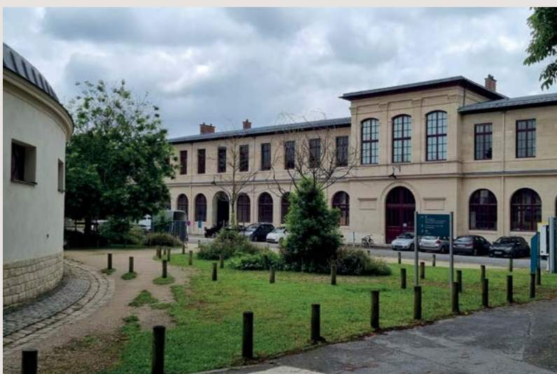
Areál Veterinární fakulty v Alfortu