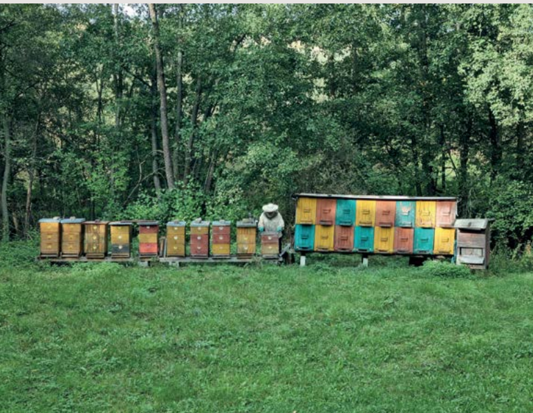
Obor choroby včel – klinické vzdělávání I. stupně