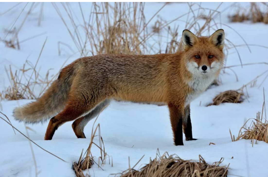
Obor choroby zvířete – klinické vzdělávání I. stupně