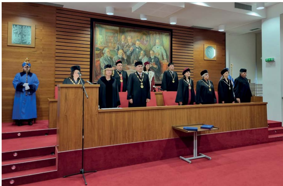
Slavnostní promoce – vedení univerzity, fakulty a pozvaní hosté při promoci absolventů univerzity

Poté promlouvá k absolventům a celému shromáždění děkan/ka fakulty. Příjemným naplněním promočního setkání je také proslov absolventa, v němž jménem všech přítomných absolventů hodnotí studium a zpravi-