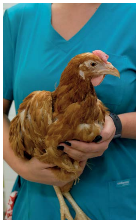
Obor choroby drůbeže a králíků – klinické vzdělávání I. stupně