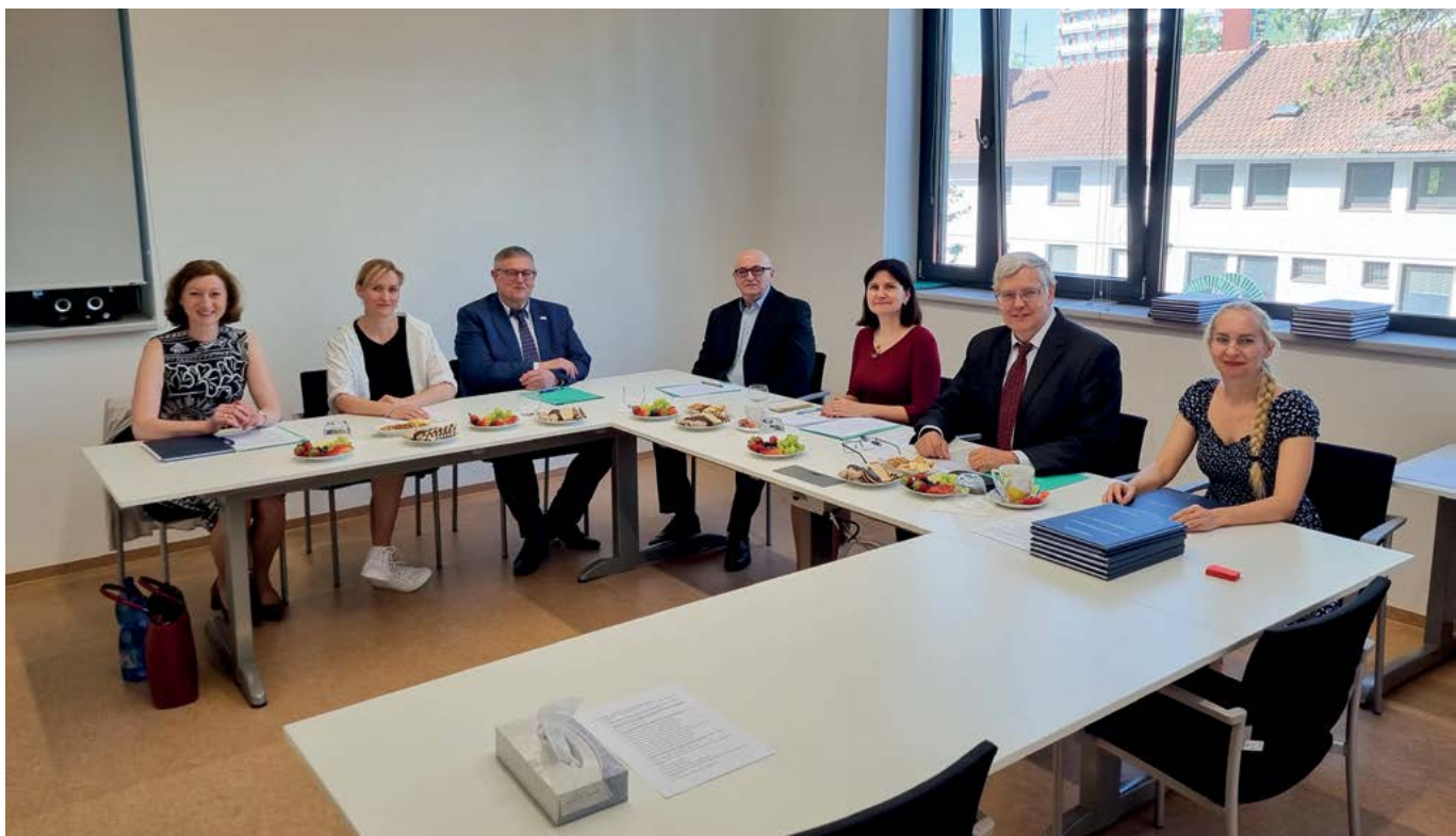
Součástí atestačního vzdělávání je ověřování odborné úrovně účastníků při závěrečné zkoušce – zkušební komise

Celoživotní vzdělávání zahrnuje oblast atestačního a specializačního vzdělávání pro státní veterinární správu, oblast klinického vzdělávání praktických veterinárních lékařů, kurzy pro úřední veterinární lékaře a další pracovníky státní veterinární správy, kurzy v ochraně zvířat, kurzy k péči o zvířata, kurzy k vyšet-