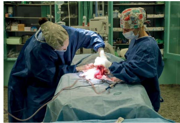
Obor choroby psů a koček – klinické vzdělávání I. stupně