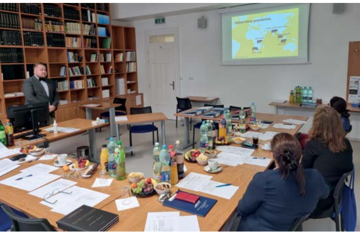
Obhajoba diplomové práce z oboru Ochrana a welfare zvířat