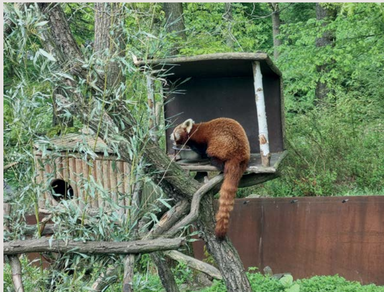
Obor choroby zvířat chovaných v zoologických zahradách – klinické vzdělávání I. stupně