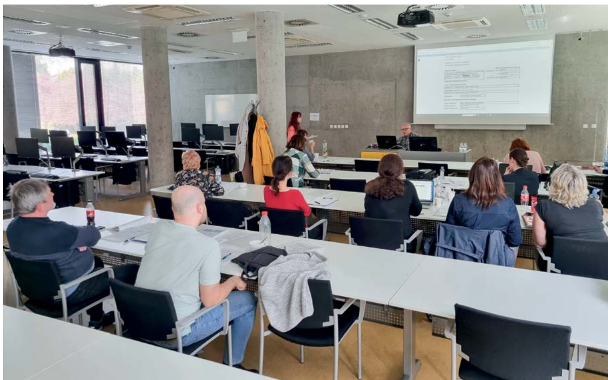
Kvalifikační vzdělávání k provádění auditů potravinářských podniků