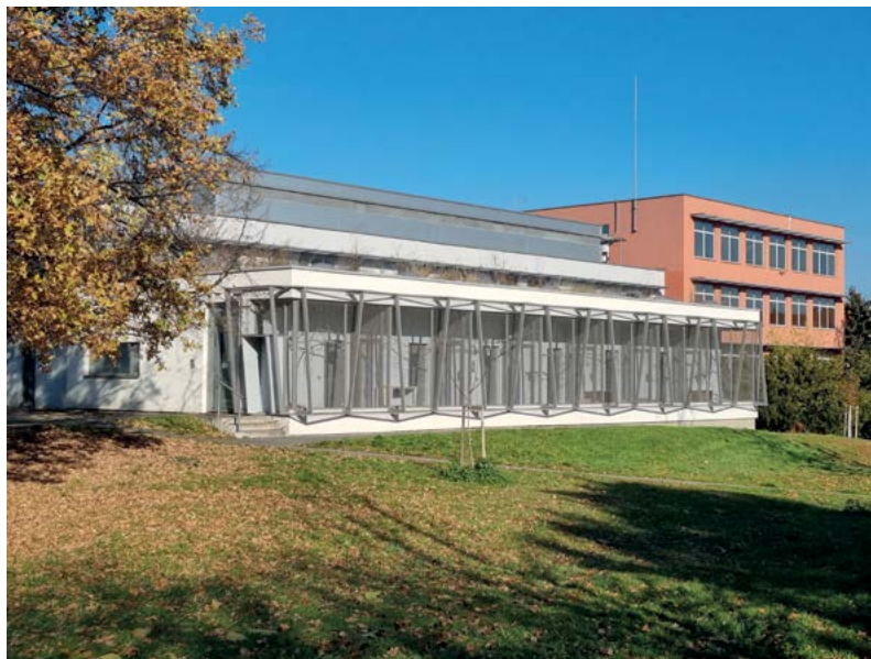
Akreditace zařízení pro zvířata využívaná k výuce a k výzkumu na univerzitě je nezbytná pro uskutečňování kvalitní veterinární výuky a tvůrčí činnosti