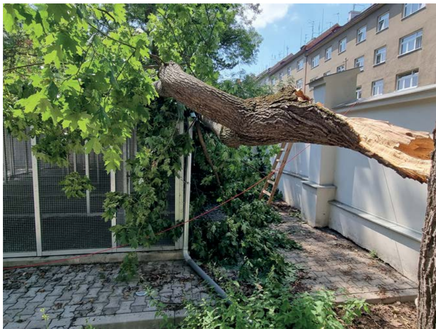
Část stromu poškodila venkovní voliery pro zvířata na univerzitě