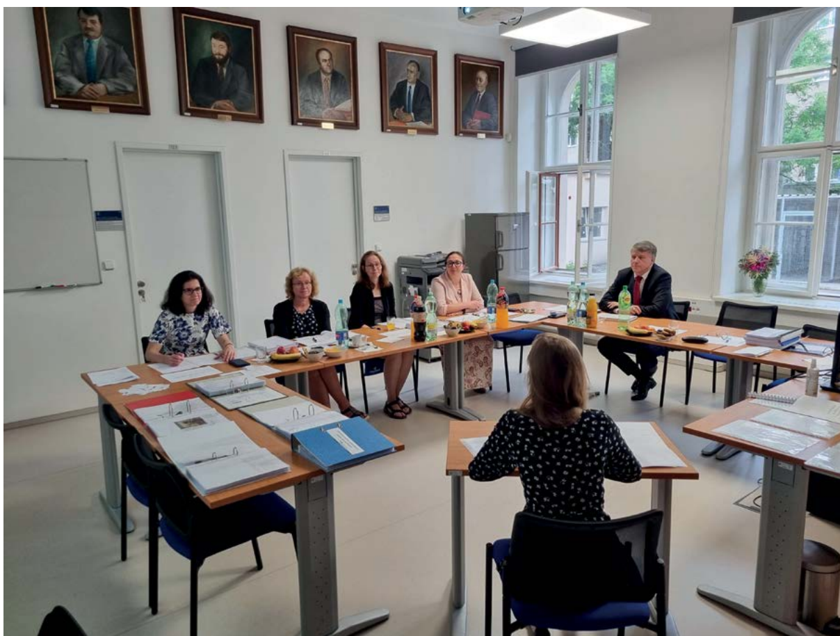
Státní zkouška v studijním programu Ochrana zvířat a welfare