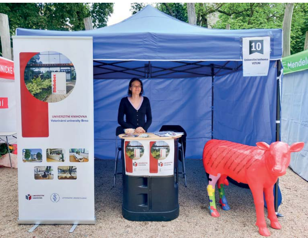
Stánek Knihovny Veterinární univerzity Brno

V úterý 4. 6. 2024 se konala v nedalekém parku u Šelepky venkovní akce Den brněnských knihoven. Jednalo se o 2. ročník, kdy knihovny různého zaměření prezentovaly své poskytované služby a aktivity netradičním způsobem. Letos se akce účastnilo 25 knihoven včetně Univerzitní knihovny Veterinární univerzity Brno. Pro širokou veřejnost byl připraven bohatý program zahrnující KnihKvíz, autorská čtení, slam poetry, dětské divadlo nebo taneční vystoupení skupiny A proč ne . Napříč odpolednem byl program doplněn o rozhovory se zajímavými hosty, jako například s paní primátorkou Markétou Vaňkovou nebo ředitelem Moravské zemské knihovny panem Tomášem Kubíčkem.