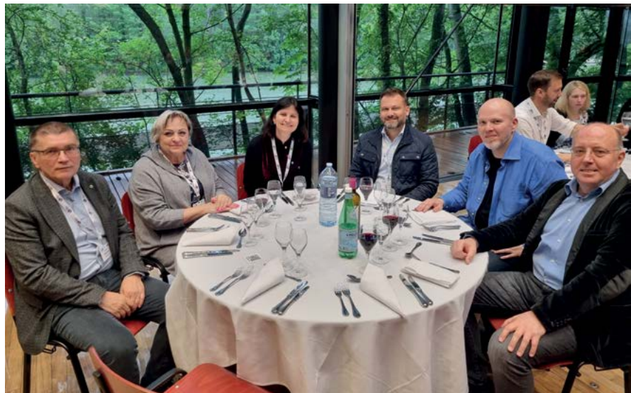
Zástupci Veterinární univerzity Brno na jednání EAEVE