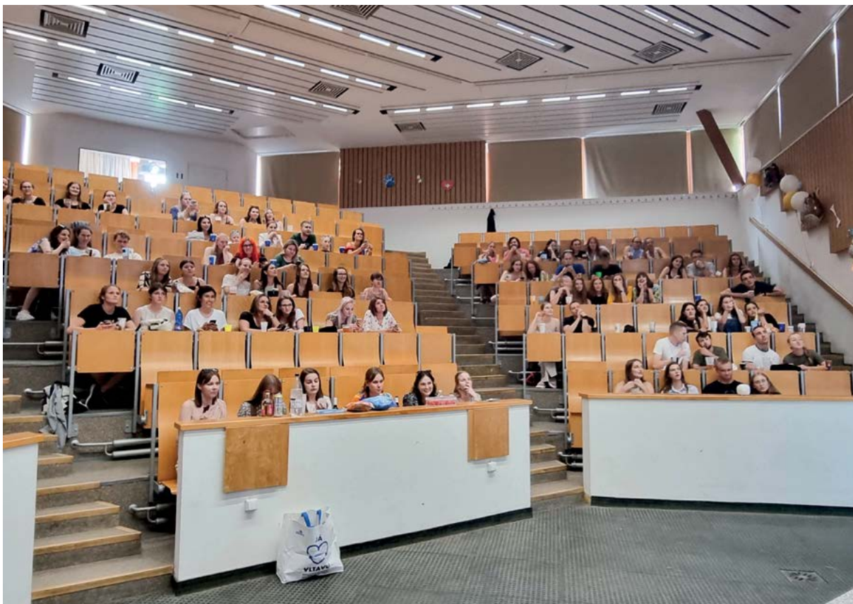
Místem setkání pro závěrečné setkání studentů byla posluchárna klinik velkých zvířat