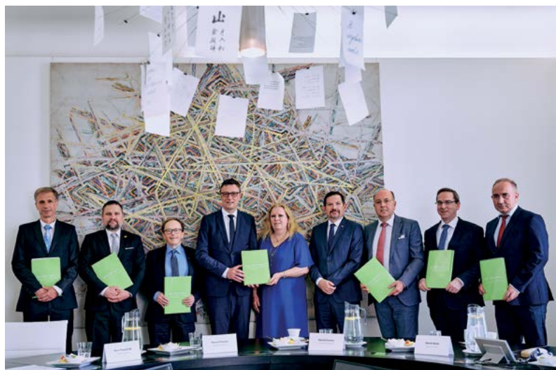
Představitelé konsorcia CEITEC a společnosti Max Planck při podpisu memoranda