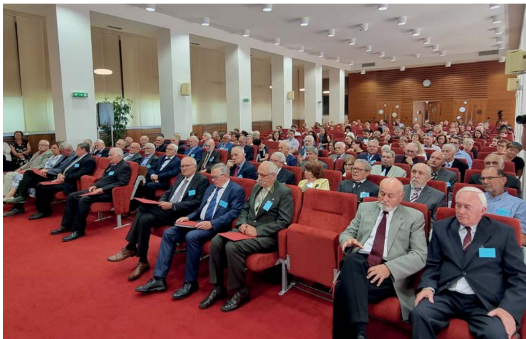
Účastníci Zlatých promocií a jejich nejbližší příbuzní a známí