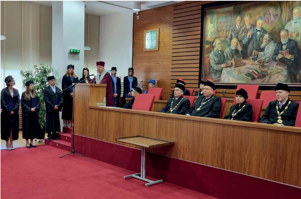
Projev rektora při promoci absolventů doktorského studia