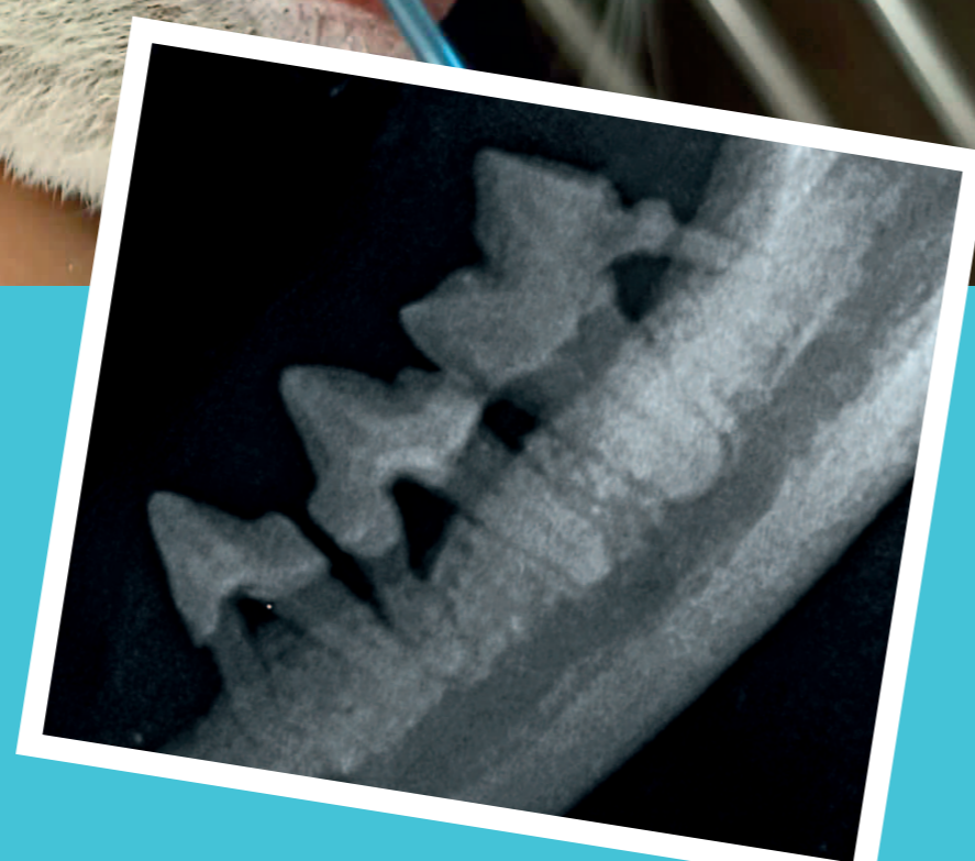
Odontoklastické resorptivní léze