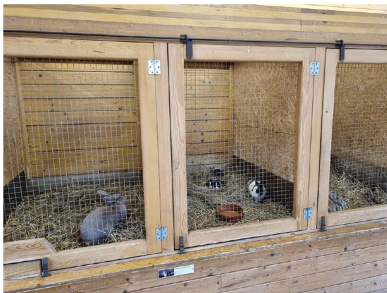
Rozvoj IVA projektů – studentských projektů na podporu kvality vzdělávání studentů

Priorita je zaměřena na pěstování duševního zdraví studujících i pracovníků, a to rozvojem poradenství k řešení složitých životních situací zaměstnanců i studentů, rozvojem areálově parkových odpočinkových zón v kampusu univerzity, podporou výsadby květin, dřevin a úpravy parku areálu univerzity, podporou