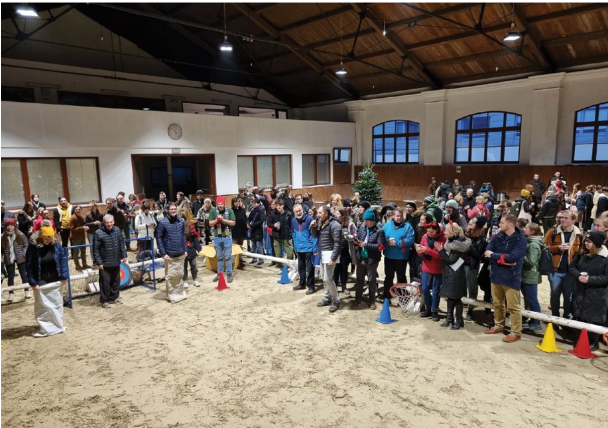
V průběhu večera probíhalo mezifakultní soutěžení v řadě netradičních disciplín