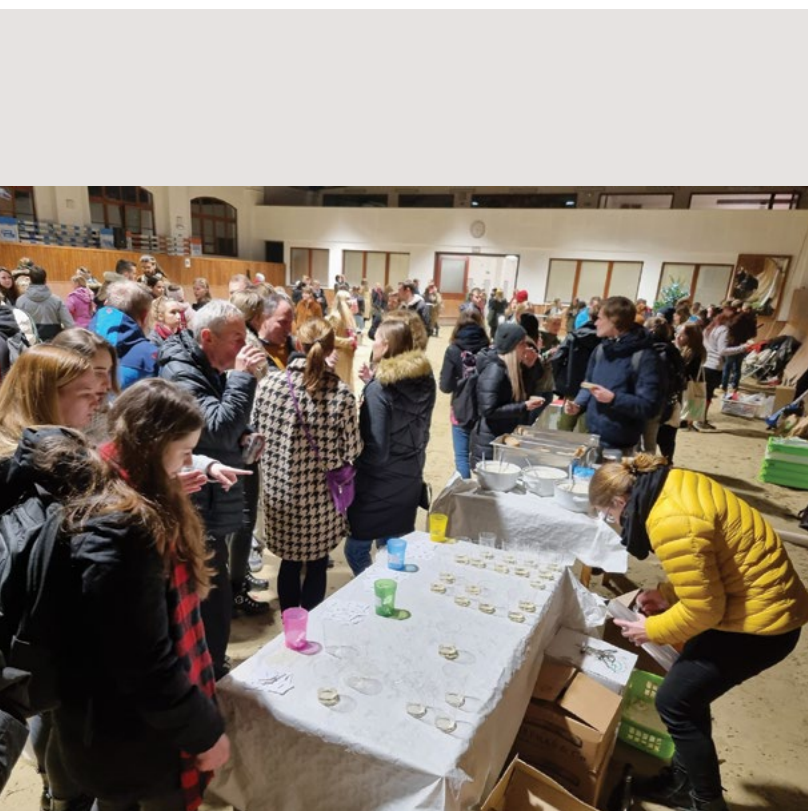
V další části večera univerzitní víno představují, k ochutnání moku lahodného slovy chvály přitahují

Soutěžení dovednostní s večerem odchází, na místo jeho talentové přichází, přednes básně vlohy umělecké prověří, pásmo veršů tu teď poběží.