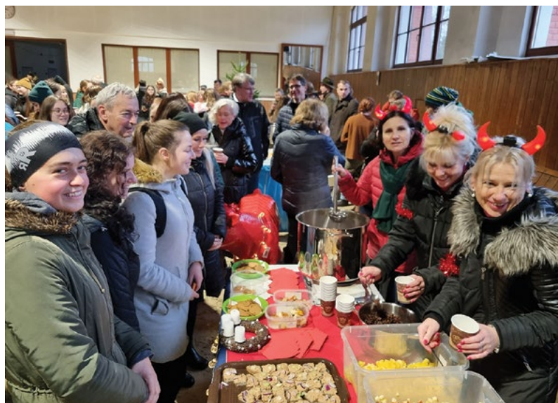
Vánoční punč Fakulty veterinární hygieny a ekologie