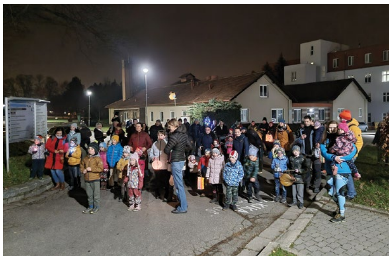
Po ukončení lampionového průvodu v areálu univerzity děti čekaly na Mikuláše