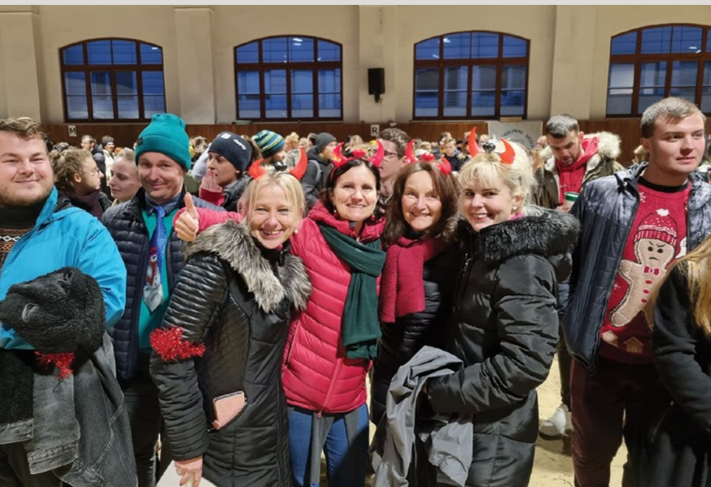
Posilování sounáležitosti studentů, učitelů a zaměstnanců s univerzitou

Obálka: Vánoční setkání k zahájení adventu na univerzitě