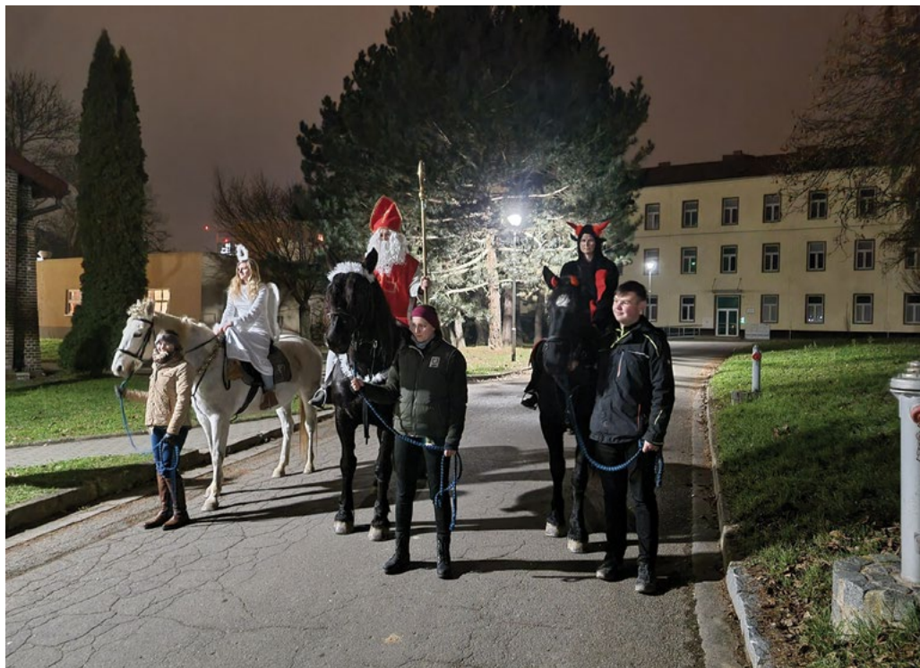
Za dětmi přijeli Mikuláš, čert a anděl na koních