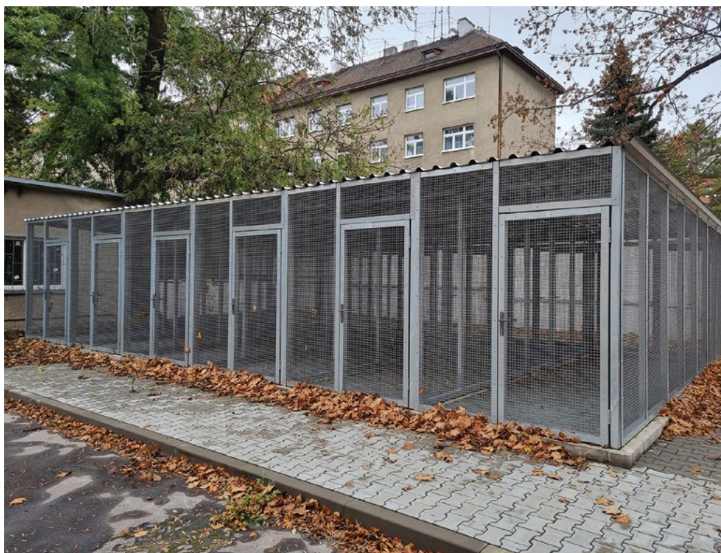
Podpora rozvoje zázemí pro výuku ochrany zvířat a dobrých životních podmínek pro zvířata

Priorita je zaměřena na zvyšování kvality studijních programů nabízených v cizích jazycích ve smyslu