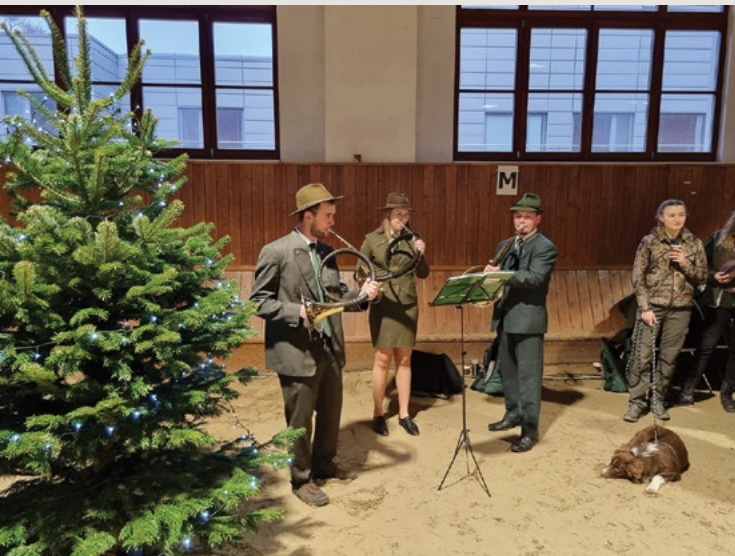
Najednou fanfáry se vzduchem nesou, atmosféru slavnostní na přítomné snesou

N ajednou fanfáry se vzduchem nesou, atmosféru slavnostní na přítomné snesou,