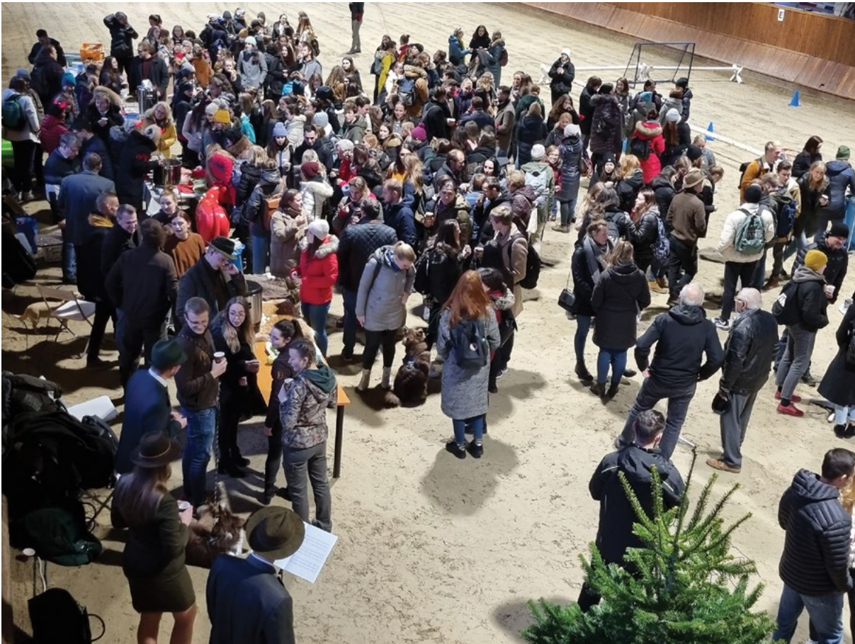
Vánoční setkání se konalo v jezdecké hale univerzity