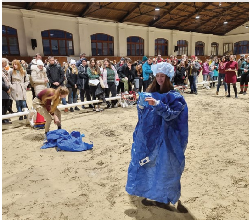
Oblékání chirurgické je další soutěží, snad výsledek nestane se mému týmu přítěží

dlouho však netrvalo naše opojení, již vzápětí přišlo další zápolení.