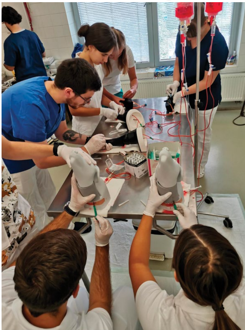
Rozvoj simulačních center pro studenty

V roce 2022 se plnění priority zaměřilo na vypracování souboru modelových případů z praxe orientovaných na zdraví zvířat a infekční onemocnění, ochranu a dobré životní podmín-