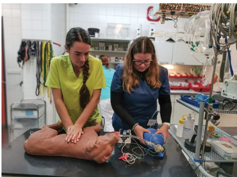
Zřízení simulačního klinického centra na klinice