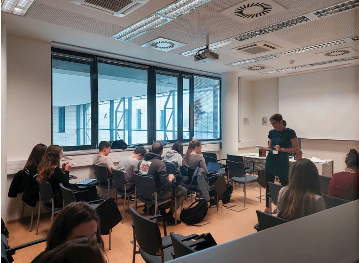
Rozšíření výuky anglického jazyka v studijních programech