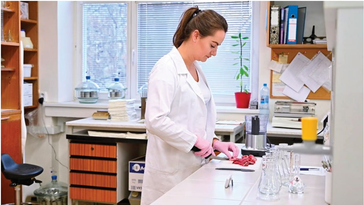
Rozvoj vzdělávání zaměřeného na hygienu potravin

v propagaci univerzity, ve zvyšování úrovně zahraniční spolupráce univerzity a při získávání studentů ze zahraničí, a to v rámci veletrhů, přímých jednání s univerzitami i zahraničními organizacemi, a ve smyslu přípravy a tisku a elektronického zveřejňování marketingových materiálů o univerzitě v angličtině pro uchazeče, studenty i zahraničí.