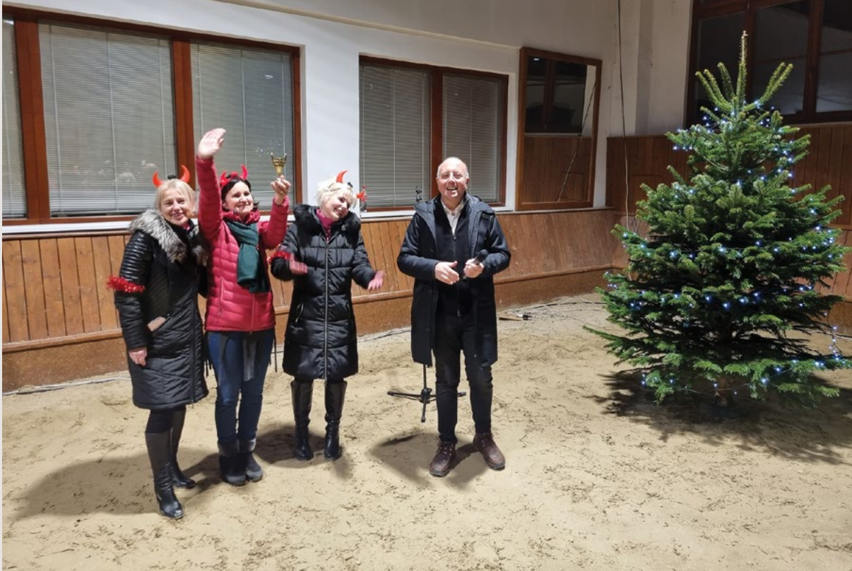
K vyhlášení punče nejlepšího dochází, vítězství na tým chutového potěšení přichází