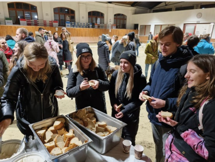
Snad vše úspěšně se vydařilo, na tvářích úsměvy vykouzlit se podařilo

P o pauze krátké tým druhý na řadu přichází, v tu chvíli se sál v hlubokém tichu nachází,