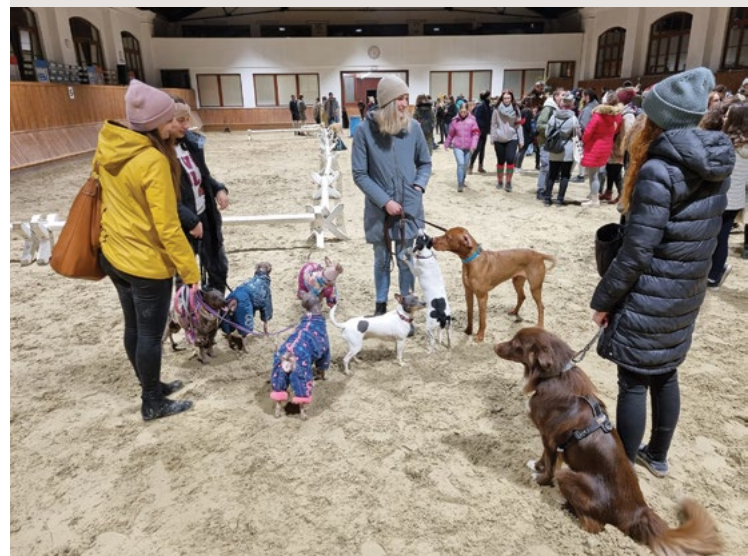
Zdá se, že se všichni dobře bavili, příchod času vánočního společně tu slavili

Poté se poslední soutěžení oznamuje, v ní fyzická síla nad duševní dominuje, spolupráce v tahu je soutěžním posláním, pevnost kolektivu je jasným poznáním, spojení pro myšlenku vítězství má ukázat, a nadšení pro fakultní zapojení dokázat, týmy soutěžících po deseti nastupují, společně ke konci lana přistupují, na povel síly prudce napínají, svaly se jim pod trikoty vypínají, na chvíli se štěstí vpravo přiklání, pak se zase v stranu levou naklání, poté se vše na středu zastaví, situace patová se dostaví, soutěžící pod námahou grimasy vytváří a výrazy svými atmosféru klání dotváří, nadšení fakultních příznivců týmy povzbudí, k nasazení poslednímu silně nabudí, napětí v sále těžce vrcholí, jak oba týmy z posledních sil zápolí, když se náhle v levé části rovnováha vytratí a s ní se víra ve vítězství potratí, druhá strana lano k sobě navinuje, průběh zápolení tu teď kulminuje, nalevo někteří už k zemi padají, ostatní však zbytek síly své k záchraně vydají, vpravo se však něco děje, příběh k překvapení svému spěje, řada soutěžících padá, lano pouští a na zem se skládá, šťěstěna se v zápolení na stranu levou přiklání, nakonec se její tým vítězně uklání, na závěr přichází rukou podání, a s ním končí fakultní utkání.