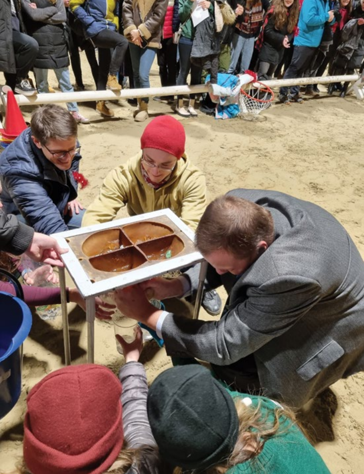
Vodě strukem umělým protékat se nechce, i když se silně tahá, anebo když lehce

Připravili soutěž v zručnosti dojení, by prověřili získávání mléka umění,