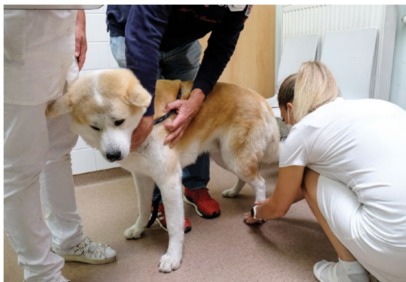
Rozšíření klinické výuky ve veterinárním vzdělávání

umění v areálu formou organizace výstav (fotografií, případně obrazů aj.), podporou hudebních vystoupení v areálu univerzity pro studenty i zaměstnance, podporou animálních prvků v areálu univerzity, omezováním hlukových aktivit v areálu univerzity, snižováním parapracovního a parastudijního stresového zatížení zaměstnanců i studentů a podporou