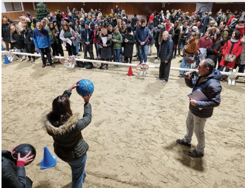
Koš na basket na zem postaví, vzdálenost od mety cílové vystaví

ovace přítomných je jim odměnou, když získávají výhru vysněnou.