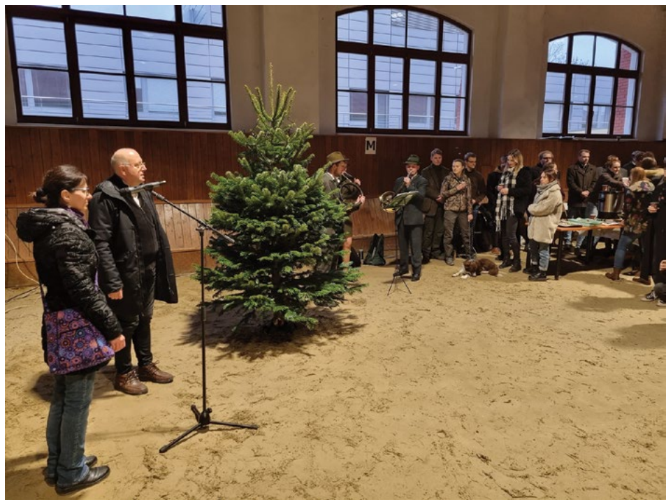
Rektor a prorektorka univerzity zahajují vánoční setkání studentů, učitelů a zaměstnanců

Při vyhodnocování vánočního punče nejvíce bodů získal punč připravený na Fakultě veterinární hygieny a ekologie.