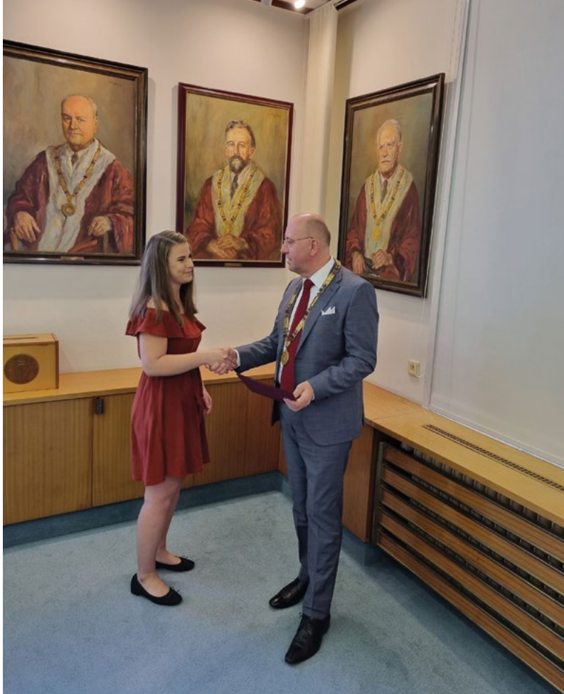
Předávání ocenění za mimořádnou činnost