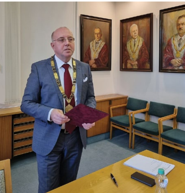
Rektor univerzity předává studentům a akademickým pracovníkům mimořádná ocenění