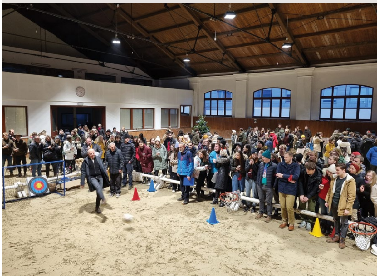
Fotbalová šikovnost se zjišťuje, kdo gólů víc dá, se z vítězství raduje

V ní se umění fotbalové zjišťuje, kdo gólů víc dá, se z vítězství raduje, míč několikrát na bránu směřuje, do jejího prostoru svůj obsah svěřuje, další výkop a střelec v odhadu se mýlí, jeho rána mimo branku cílí, protihráče prudce zasahuje, ten předklání se, ruce roztahuje, tělo své na zem těžce přemísťuje, výraz zděšení na tvář svou umísťuje, kolegyně na pomoc mu spěchá, trochu dechu popadnout ho nechá, pak mu k ústům hrnek punče přistaví, loků pár na nohy jej postaví.