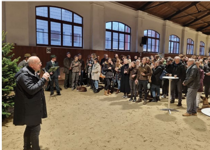
Rektor o čase vánočním hovoří, do myšlenek hlubokých se ponoří

fakulta úspěch oslavuje vřele, do soutěže další se už hlásí směle.