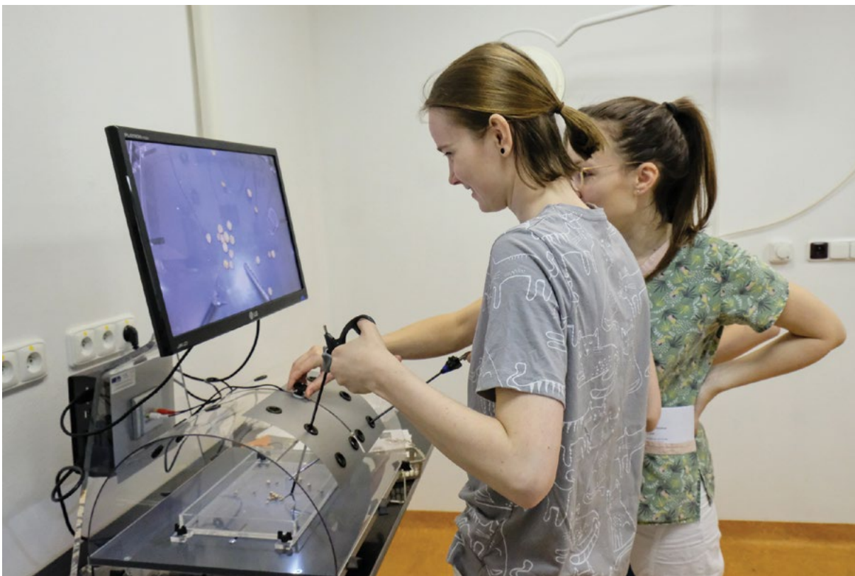
Podpora výuky endoskopie a zobrazovací diagnostiky

V roce 2022 se plnění priority zaměřilo na zpracování kariérního řádu na univerzitě.