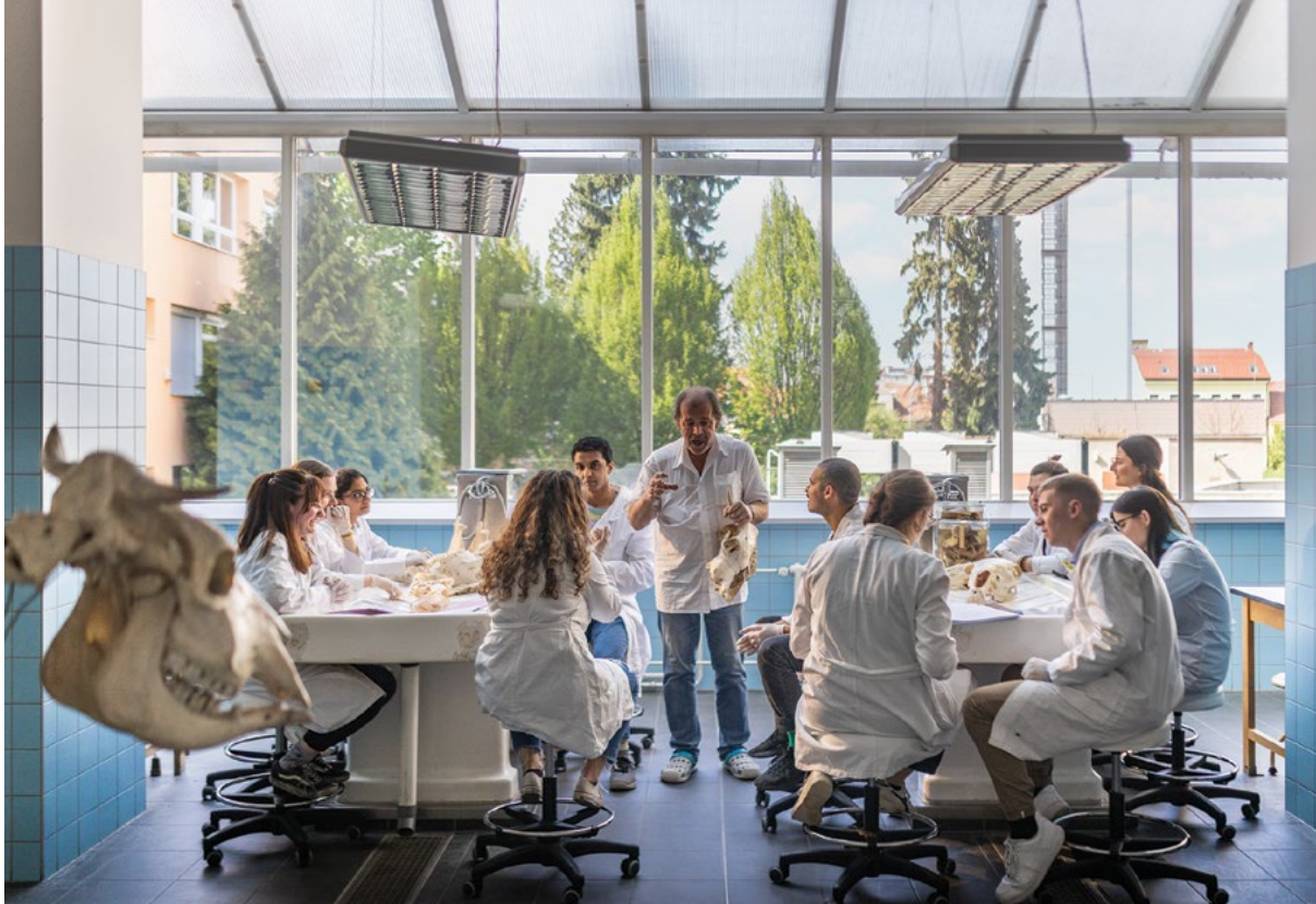
Rozvoj praktické výuky studentů na pitevnách

V roce 2022 se plnění priority zaměřilo na přípravu na jednání a aktivní účast univerzity na jednání EAEVE.