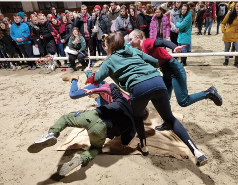
Do změní lidské se mají proplést a tvora nezvyklého společně upléstí

Oblékání chirurgické je další soutěží, snad výsledek nestane se mému týmu přítěží,