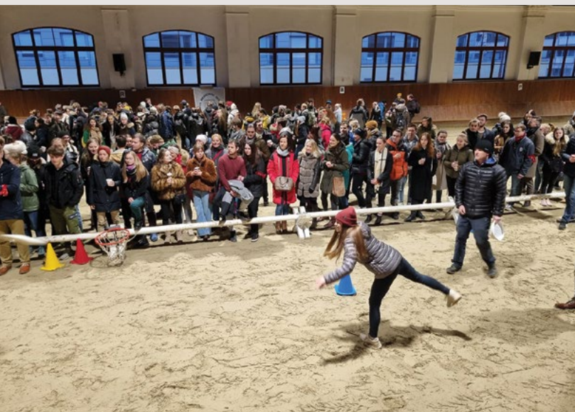
Dovednost v hodu diskem se ověřuje, umění cíl zasáhnout se poměřuje

V ní se umění fotbalové zjišťuje, kdo gólů víc dá, se z vítězství raduje, míč několikrát na bránu směřuje, do jejího prostoru svůj obsah svěřuje, další výkop a střelec v odhadu se mýlí, jeho rána mimo branku cílí, protihráče prudce zasahuje, ten předklání se, ruce roztahuje, tělo své na zem těžce přemísťuje, výraz zděšení na tvář svou umísťuje, kolegyně na pomoc mu spěchá, trochu dechu popadnout ho nechá, pak mu k ústům hrnek punče přistaví, loků pár na nohy jej postaví.