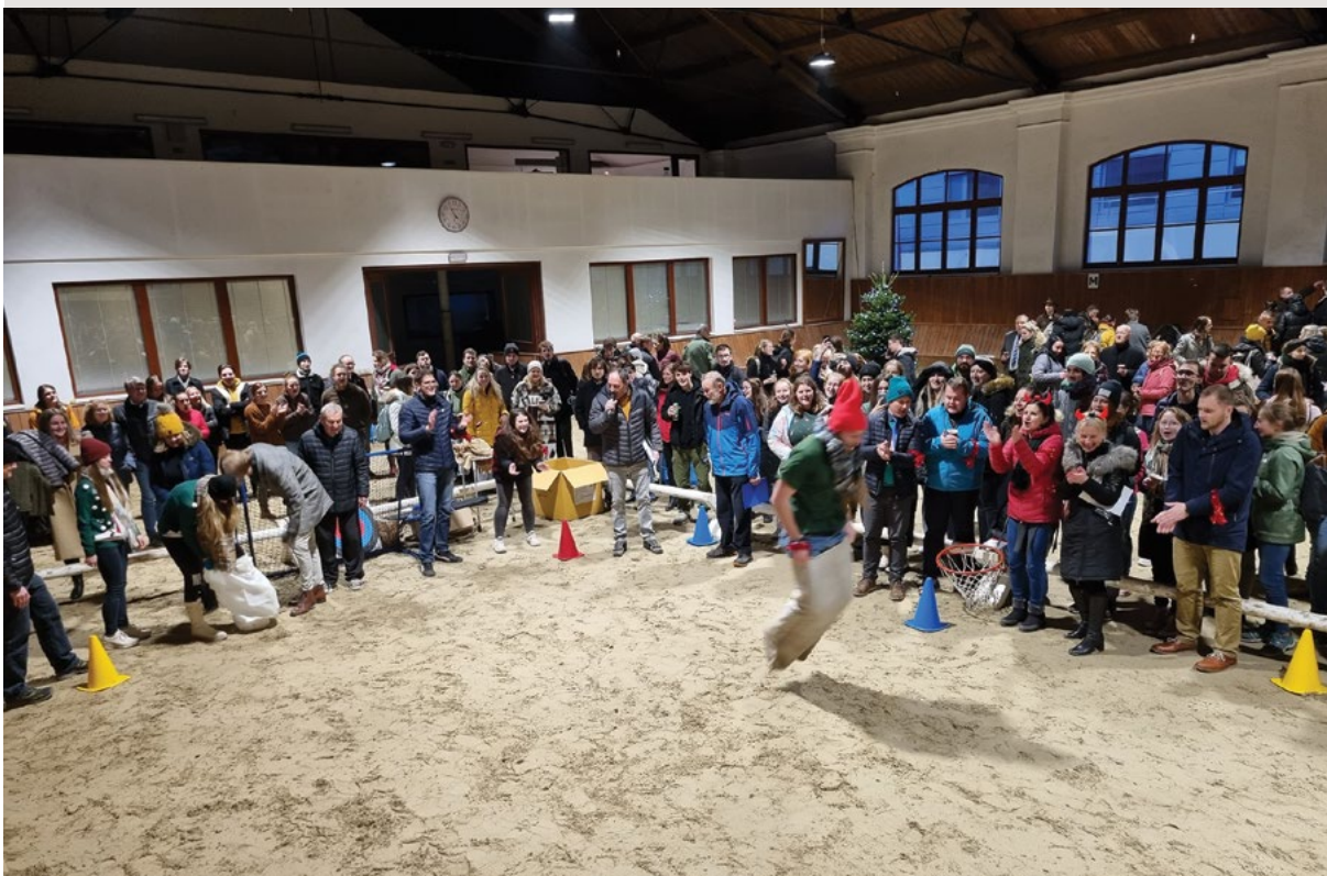
Vybraný člen týmu vak na nohy nasazuje, zaječími skoky po dráze poskakuje

nad výkonem jeho zůstal temný stín, když vítězství získal druhý tým.