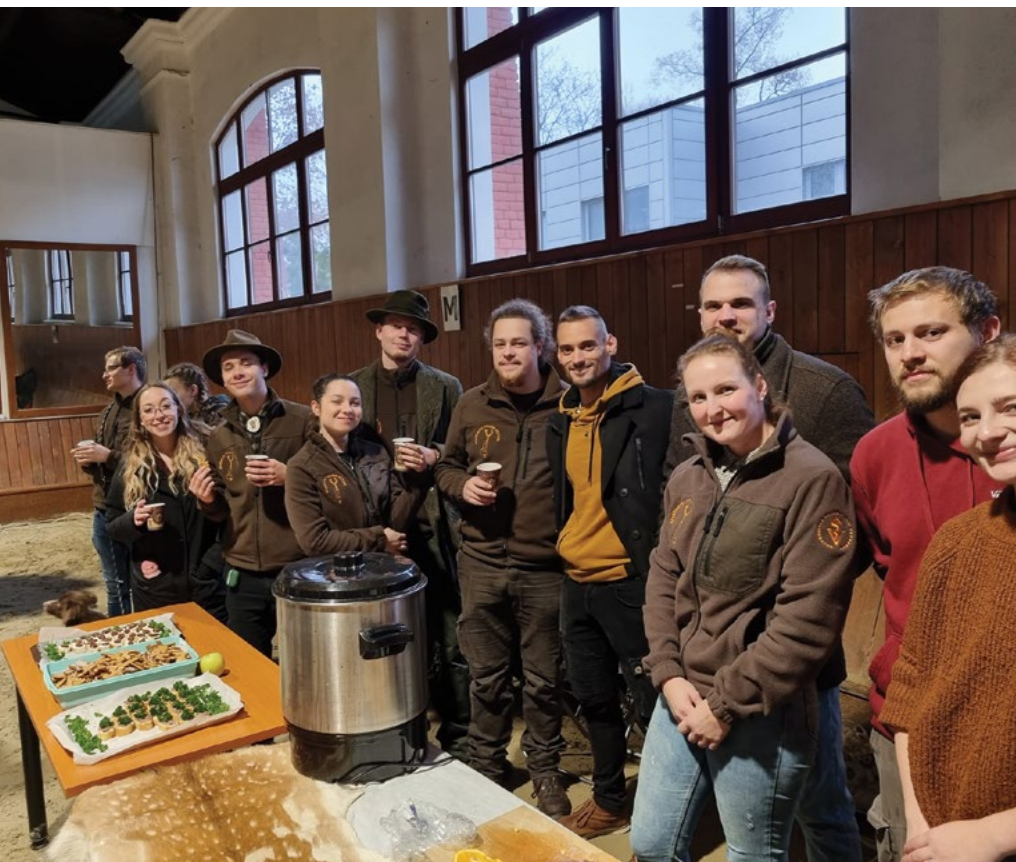
Vánoční pití a občerstvení zajišťoval také myslivecký kroužek univerzity

Rektor univerzity předal vítěznému týmu mezifakultního soutěžení pohár pro nejlepší tým a stejně tak předal pohár vítězům v soutěži o nejlepší vánoční punč.