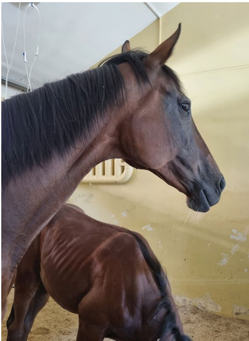
Podpora klinické výuky na univerzitě

dinného života, podporujících kvalitní průběh studia a jeho úspěšné zakončení, prostřednictvím zajištění proškolení akademických pracovníků – školitelů a studentů doktorských studijních programů.